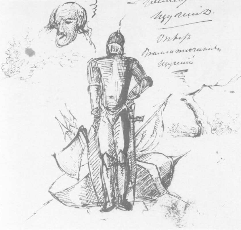
«Маленькие трагедии». Обложка (ГД 1621).