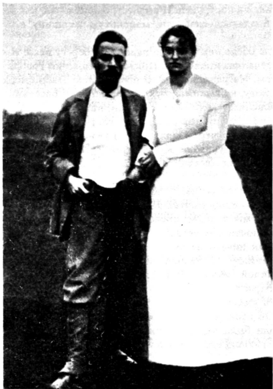
Рильке с женой Кларой Рильке-Вестхоф в 1901 году