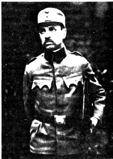
Рильке на военной службе. Вена. 1906 год