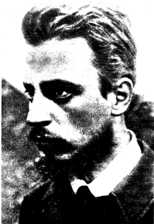
Рильке в 1900 году