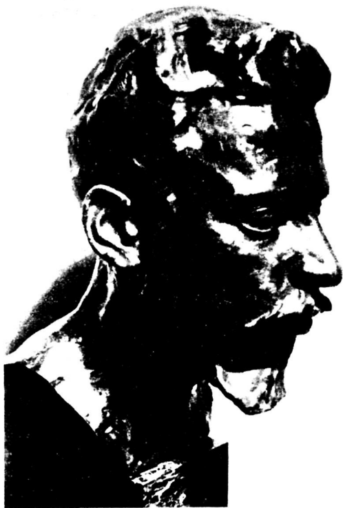
Рильке в 1901 году. Бюст работы жены поэта Клары Рильке-Вестхоф