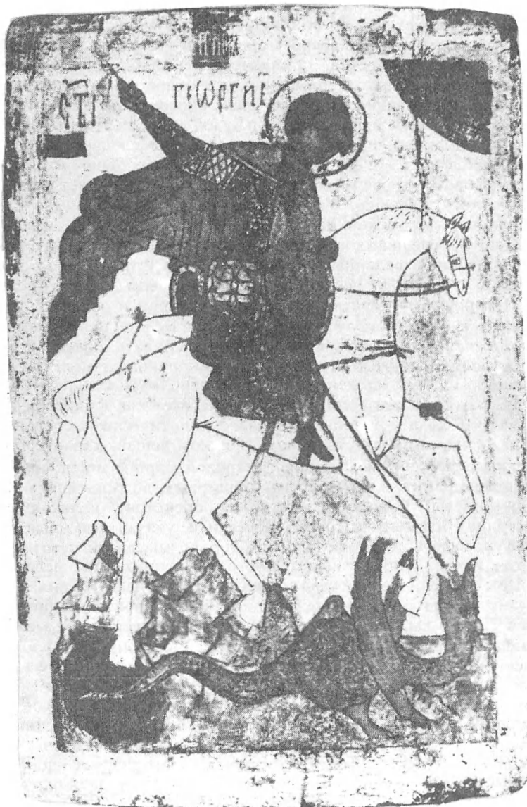
Галерея ратной славы