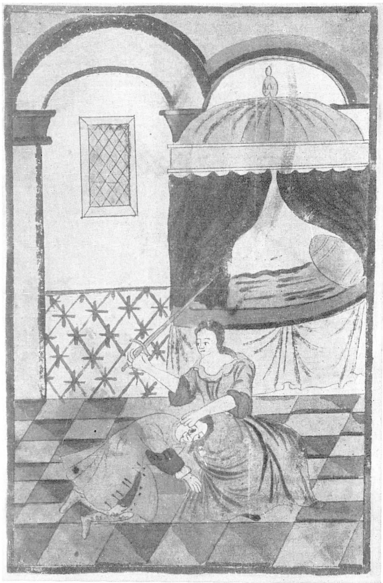
Рис. 2. Тира заносит меч над Александром, российским кавалером. ГПБ, ф. XV. 69.