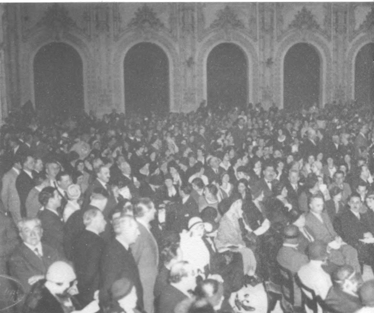
8-9. Зал на лекции Вяч. Иванова “Дух современности и его ориентиры”, казино в г. Сан-Ремо, 19 апреля 1933 г.