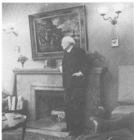
14-20. У М. Бодмера в замке Фрейденберг, Цюрих, 31 октября 1934. На заднем плане – “Мадонна” Боттичелли.