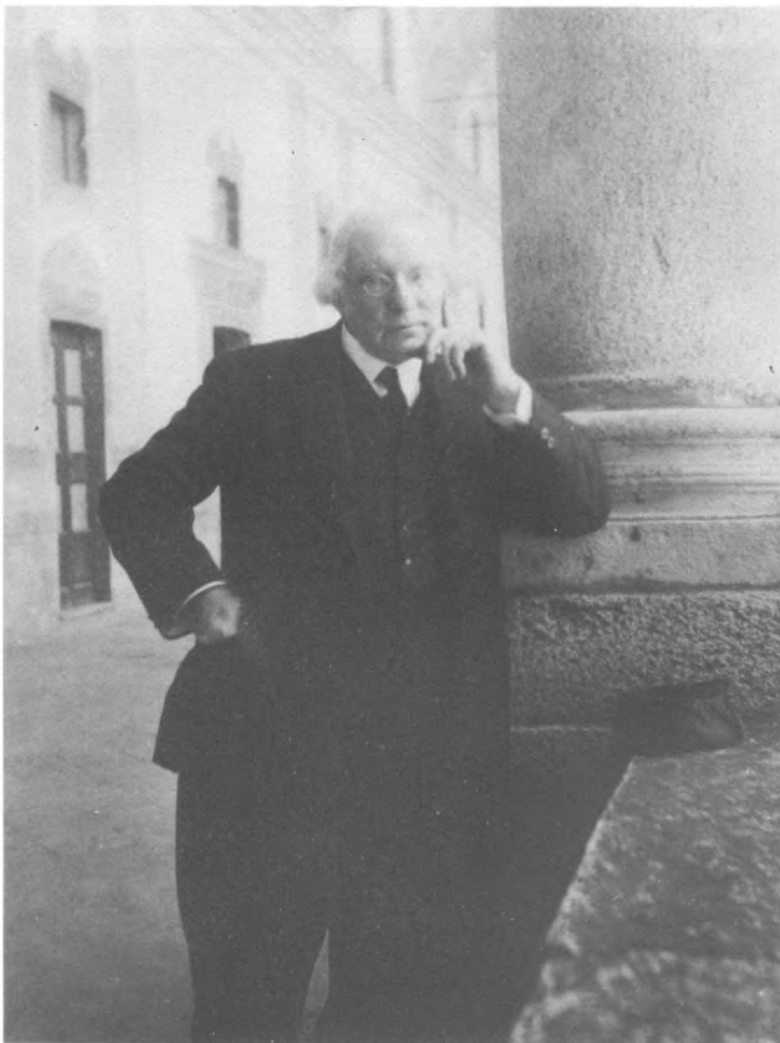
7. Вяч. Иванов недалеко от квартиры на Капитолии, 1930-е гг.