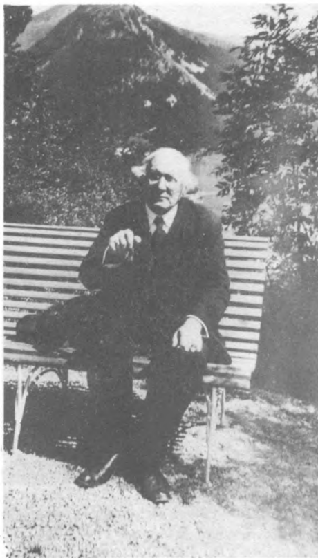
11 В. И. Иванов в Давосе, Швейцария, лето 1929/30 г.