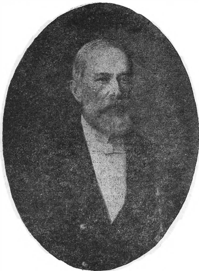
Николай Христианович Бунге (1823—1895 гг.)

образом на германском фондовом рынке, требуют коренной реформы — восстановления золотого обращения. Не все удалось ему осуществить из задуманного; многое осталось лишь в стадии первичной подготовки (например, валютный вопрос и подоходный налог) для его преемников.