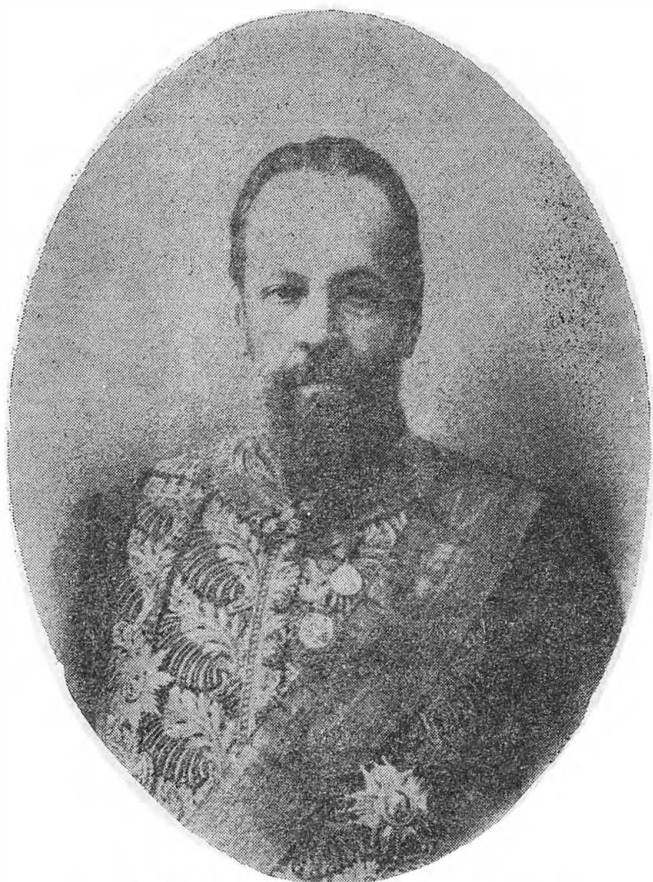
Сергей Юльевич Витте (1849—1915 гг.)

безразличными, которым «все все равно», чуждыми близкого знания России и жизни, с людьми «в футляре», внешних форм, а не твердых идей и смелых замыслов, с людьми, все содержание деятельности которых сводилось «к движению по службе государственной», то были большей частью сторонники самого вредного для государственного строительства вида мышления — мышления «жупельного», запугивающего разными словами. Витте и футлярность, Витте и шаблонность не совмещались воедино. Подобно высокоствольному маячному дереву, он высился над низкоствольни-