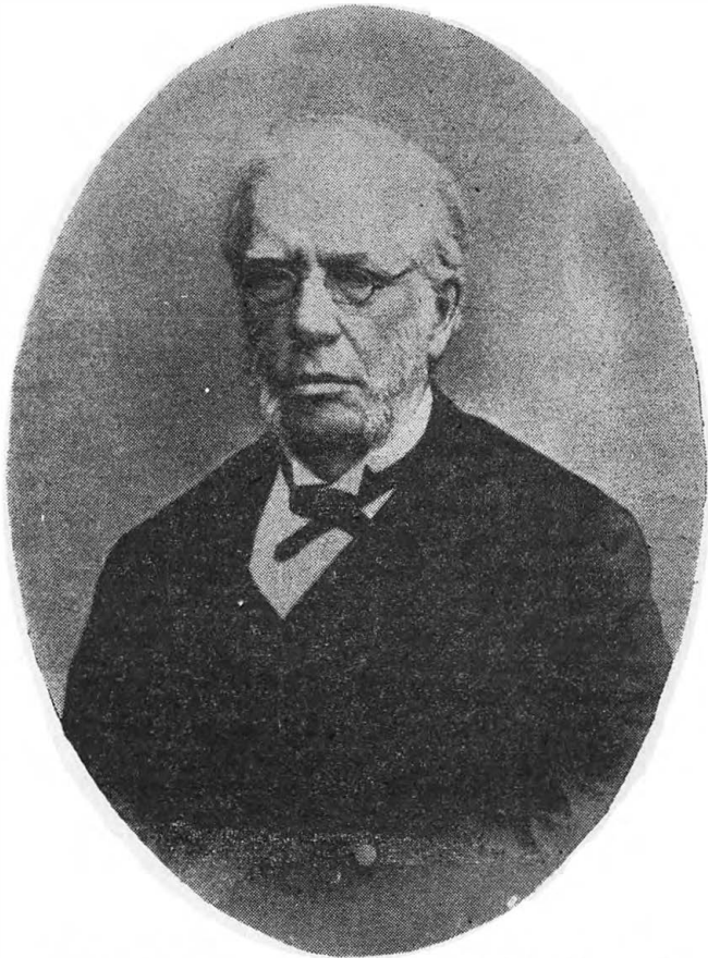
Иван Алексеевич Вышнеградский (1831—1895 гг.)

В противоположность Н. Х. Бунге, деятельность и заботы преемника его, И. А. Вышнеградского, сосредотачивались главным образом на финансовых вопросах (займы, конверсии, бюджет и пр.), на покровительстве нашей промышленности и упорядочении железнодорожного дела. Он был типичным выразителем «финансизма», мало интересовался вопросами социально-экономическими — рабочим и крестьянским. Зато И. А. Вышнеградский вкладывал все свои знания и душу в обширный замысел: создать национальную промышленность, освободить наш рынок от ввоза иностранных изделий (и прежде всего — от произведений гер-