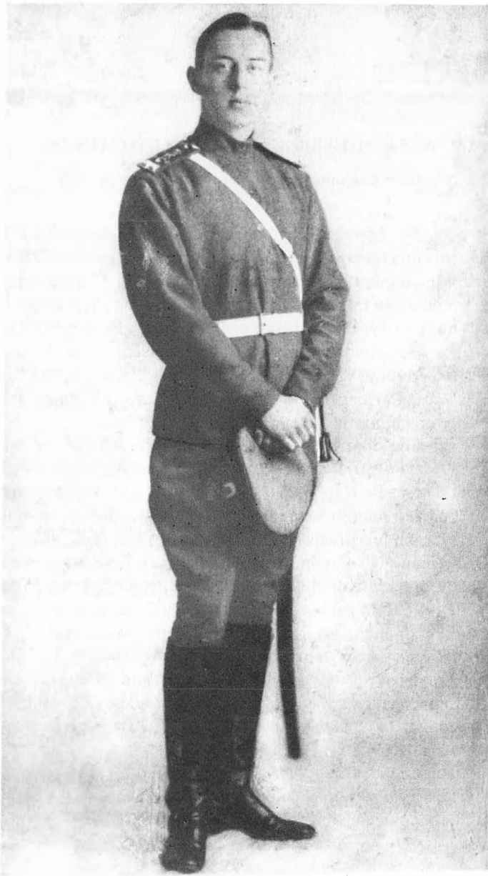
А.А.Стедьин. Приблизительно 1917–1921 гг