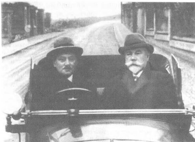
А.И.Деникин и П.В.Колтышев. 1934 г.

ницей национальной России — своей второй родиной — Францией.