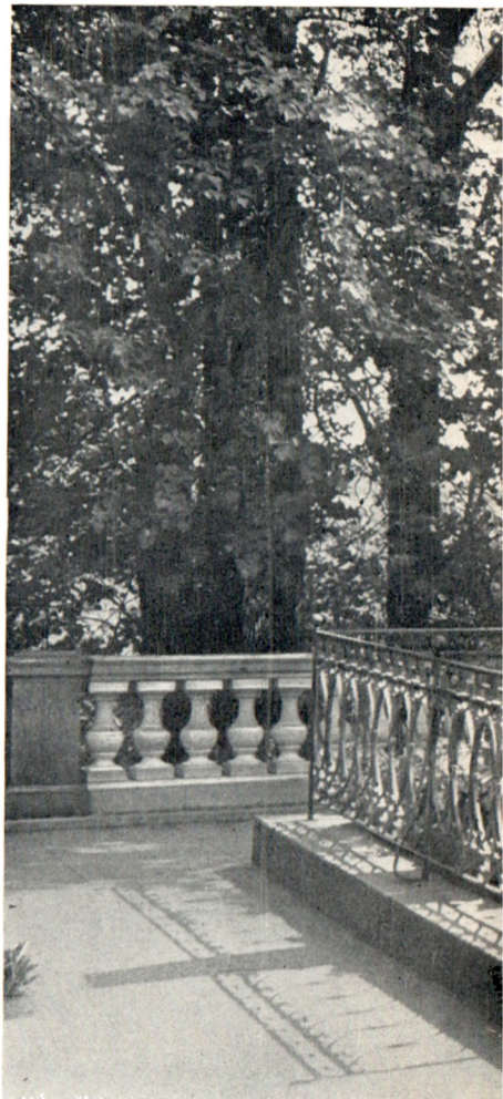
Могила А. С. Пушкина у стен Святогорского монастыря