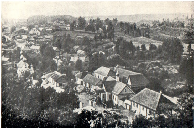
Святые Горы. 1899 г. Савкина горка