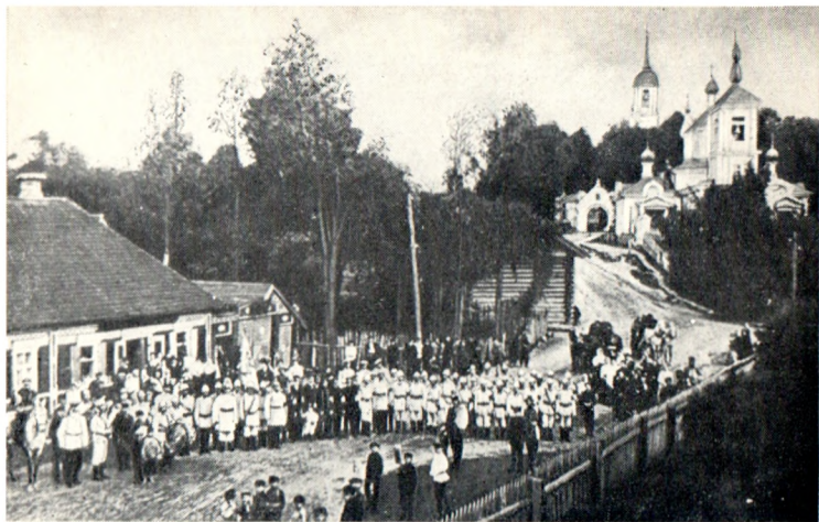
Смотр пожарной дружины в Святых Горах. 1899 г.