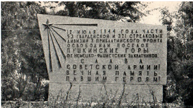
Памятная стела на могиле воинов-освободителей