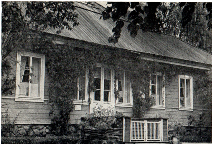
Дом-музей в Михайловском