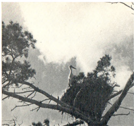
Гнездо аистов в Михайловском