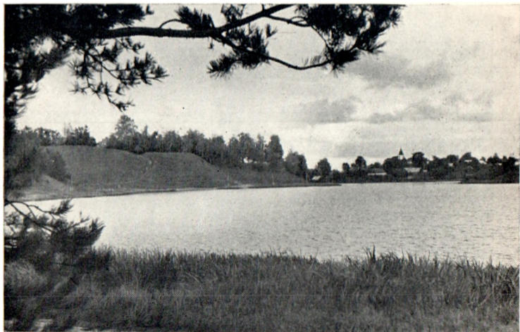
Вид на озеро Велье