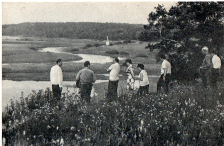
Туристы в окрестностях Пушкинских Гор