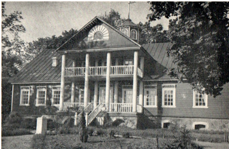
Восстановленный дом Ганнибалов в Петровском