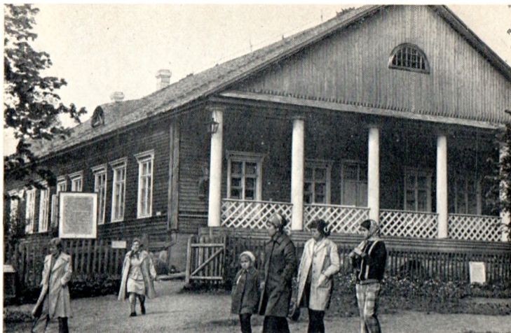
Дом-музей Осиповых-Вульф в Тригорском