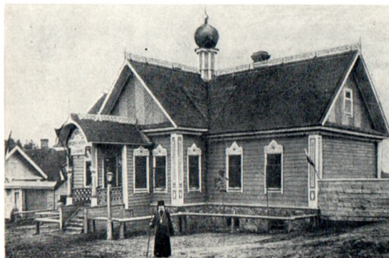
Библиотека-читальня, открытая в память А. С. Пушкина