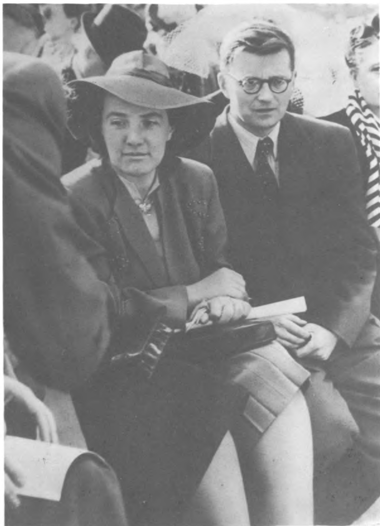
Н. В. и Д. Д. Шостаковичи в Праге. 1946 г.