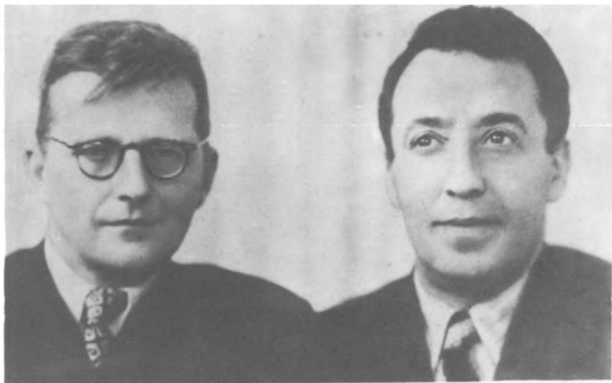
Д. Шостакович и И. Гликман. Ленинград, 1958 г.