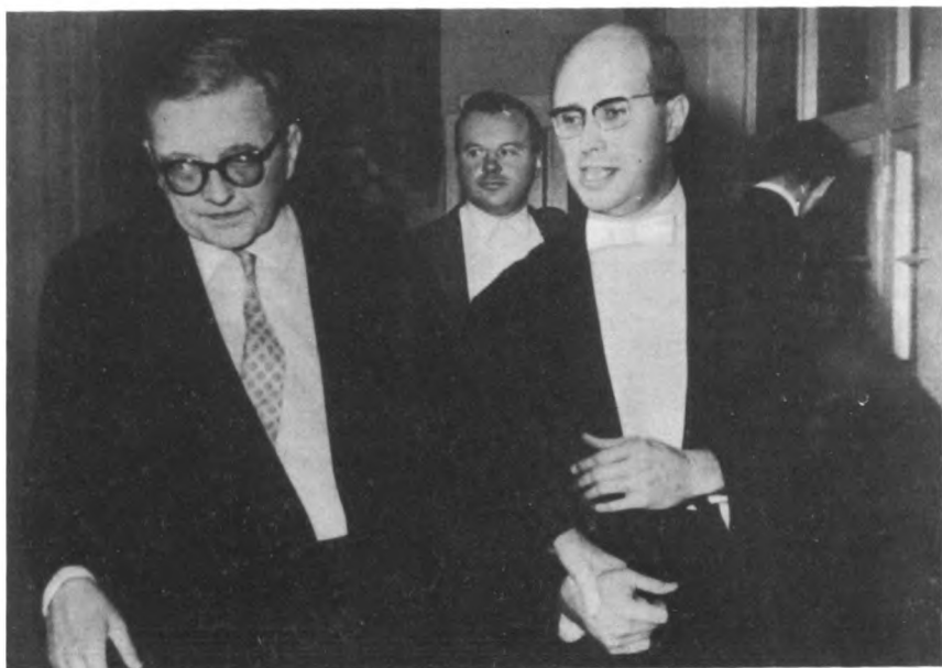
Д. Шостакович, Е. Светланов, М. Ростропович после премьеры Второго виолончельного концерта