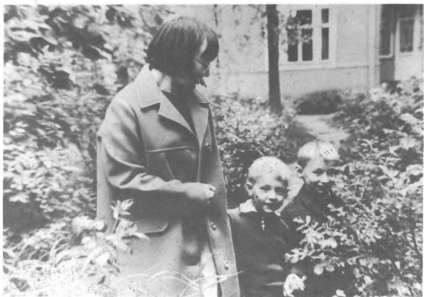
Галина Шостакович с детьми в Репине