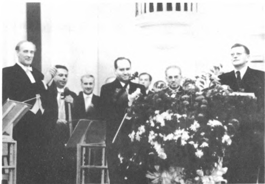
Премьера Первого скрипичного концерта: Е. Мравинский, Д. Ойстрах, Д. Шостакович. Ленинград, 1955 г.