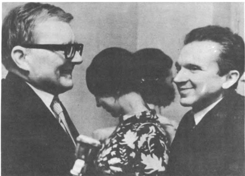
Д. Д. Шостакович и О. Ю. и М. С. Вайнберги в артистической Большого зала консерватории (Москва) после премьеры Пятнадцатой симфонии