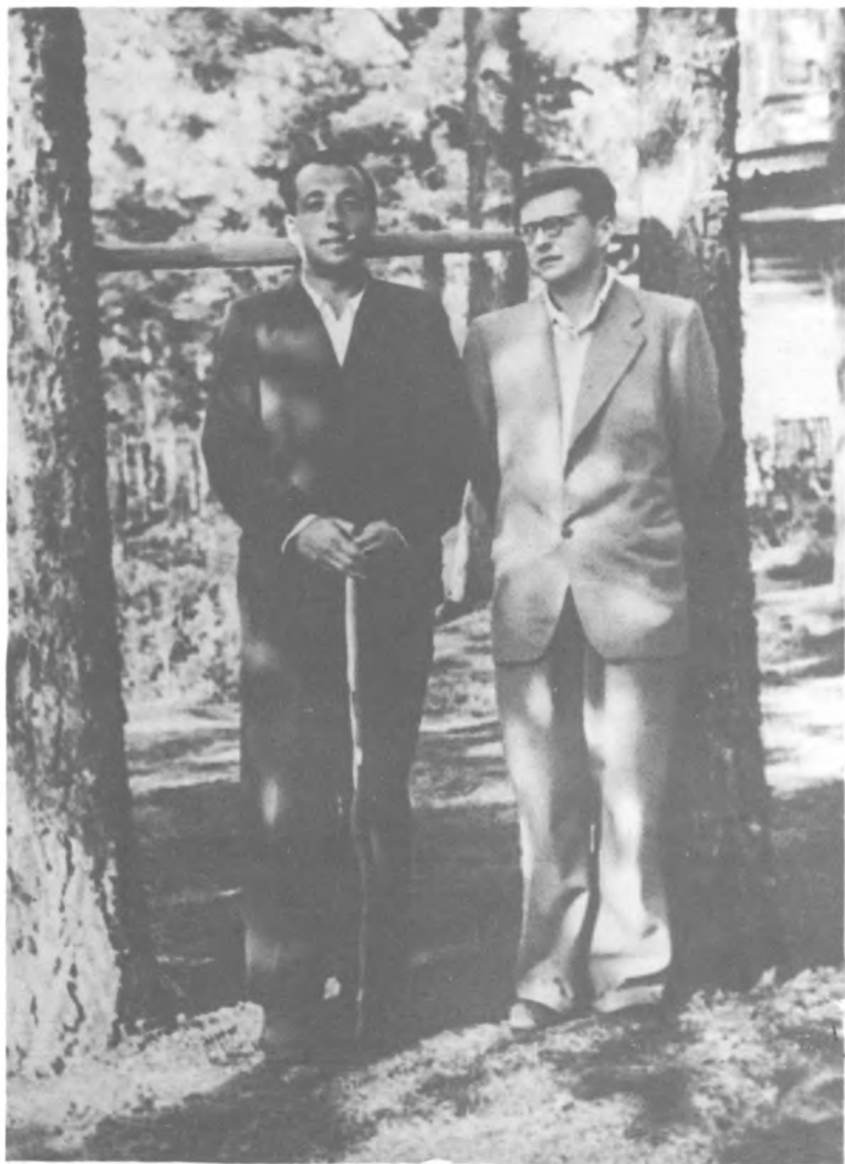
И. Гликман и Д. Шостакович. Комарово, 1954 г.