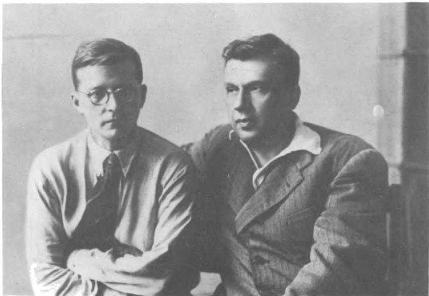
Д. Шостакович и И. Соллертинский в Новосибирске