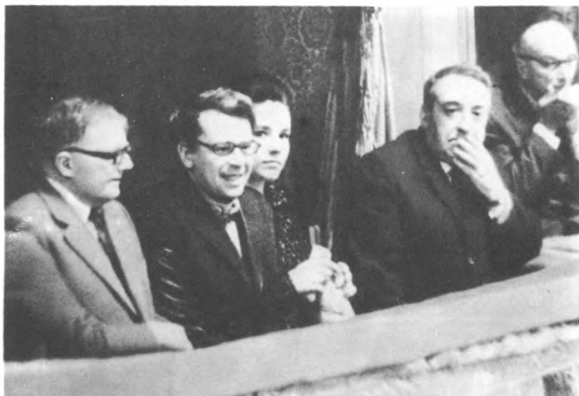
В Малеготе: Д. Шостакович, Б. Тищенко, И. Богачева, И. Гликман. Март 1975 г.