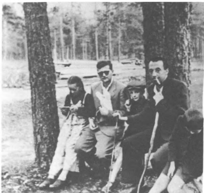
Д. Шостакович с Галей и Максимом и И. Гликман. Комарове, начало 50-х гг.