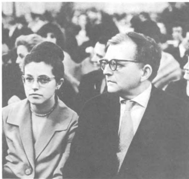
И. А. и Д. Д. Шостаковичи на концерте. 1962 г.