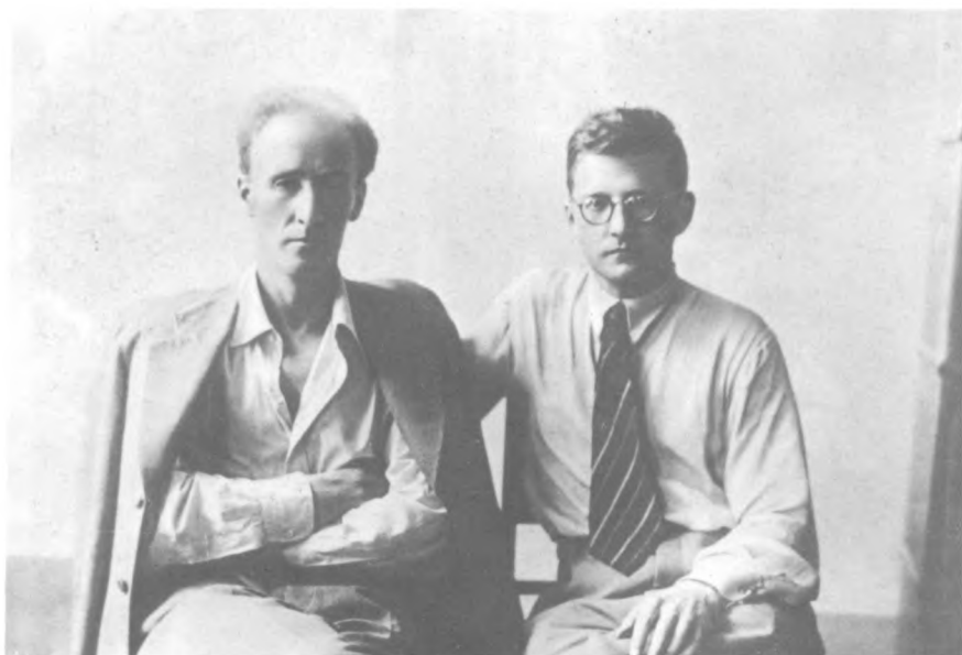
Е. Мравинский и Д. Шостакович в Новосибирске