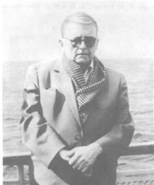
Д. Шостакович во время плавания в Кижии