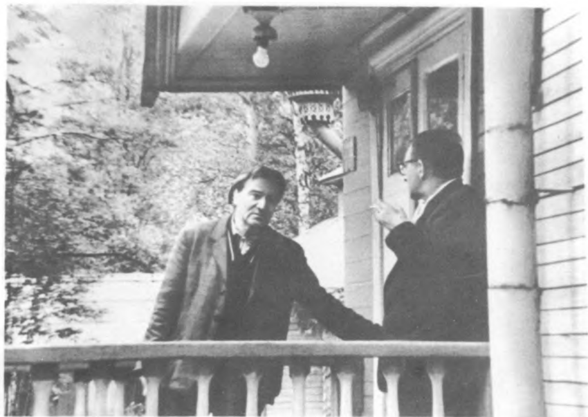
Б. Клюзнер и Д. Шостакович в Репине