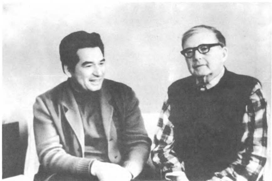
Ч. Айтматов и Д. Шостакович