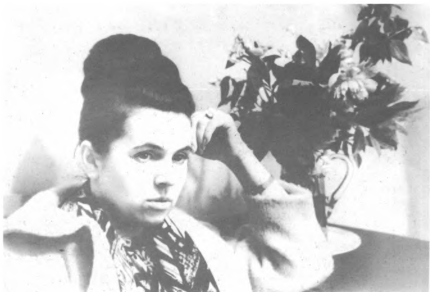
Г. Вишнеvская на записи «Катерины Измайловой» в Киеве