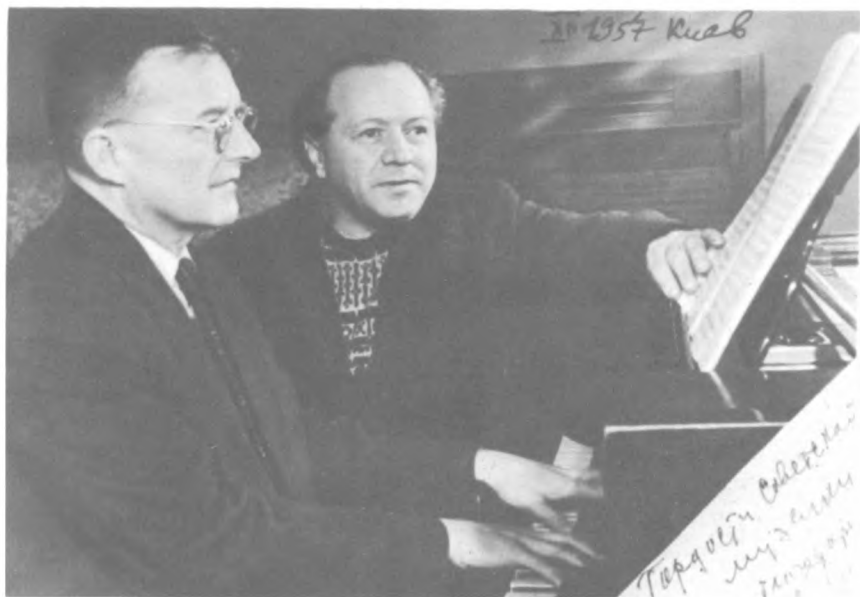
Д. Шостакович и Н. Рахлин. Киев, 1957 г.