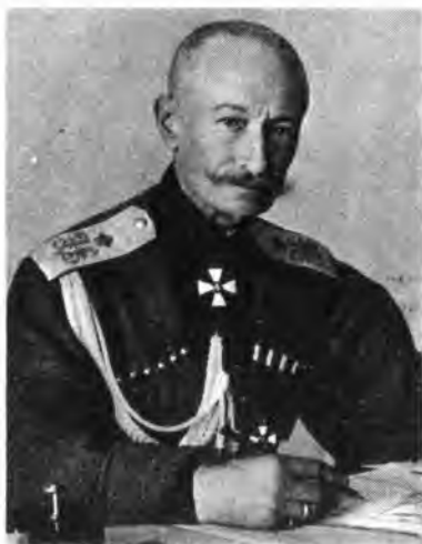
А.А.Брусилов — главнокомандующий Юго-Западным фронтом в годы первой мировой войны.