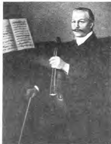
П. Н. Миллюков — председатель ЦК партии кадетов, депутат III и IV Государственных дум, министр иностранных дел в первом составе Временного правительства.