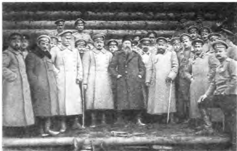
В.В.Шульгин (второй слева) на Юго-Западном фронте. 1917 г.