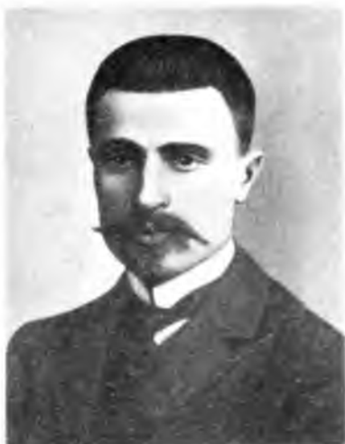
Н.Г.Церетели — депутат II Государственной думы и лидер ее социал-демократической фракции; министр почт и телеграфов, а затем министр внутренних дел Временного правительства.