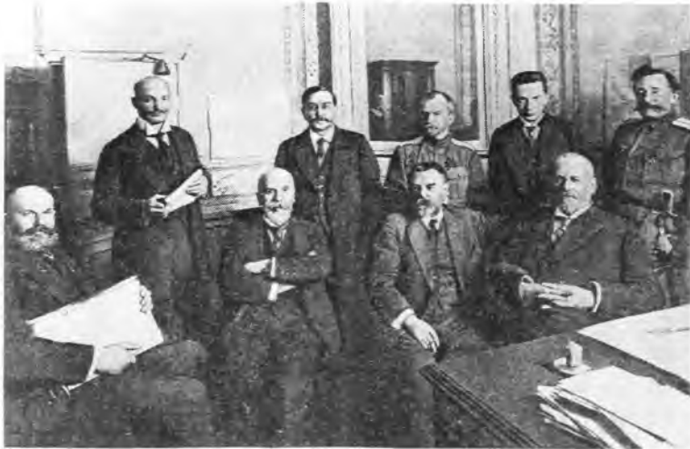
В.В.Шульгин (стоит первый слева) среди членов IV Государственной думы. 1917 г.