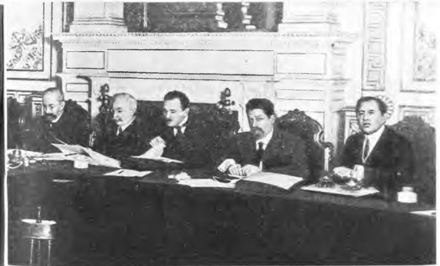
кн. Г.Е.Львов, министр юстиции А.Ф.Керенский, министр финансов М.И.Терещенко, государственный контролер И.В.Годнев, министр народного просвещения А.А.Мануйлов, товарищ министра внутренних дел Д.М.Щепкин, управляющий делами Временного правительства В.Д.Набоков.