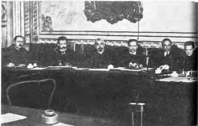
Заседание Временного правительства в Мариинском дворце. Слева направо: министр торговли и промышленности А.И.Коновалов, министр земледелия А.И.Шингарев, министр путей сообщения Н.В.Некрасов, министр иностранных дел П.Н.Милюков, председатель Совета министров и министр внутренних дел