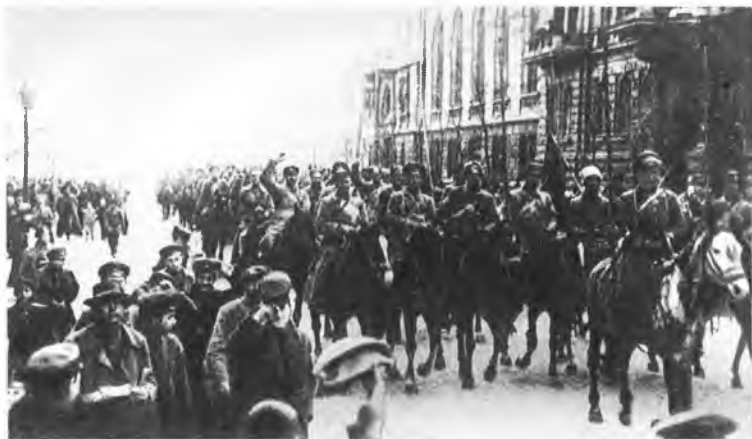
В годы гражданской войны Одесса была попеременно захвачена австро-германскими, англо-французскими, денikinскими войсками и освобождена лишь в феврале 1920 г. На фото: вступление Красной Армии в Одессу.