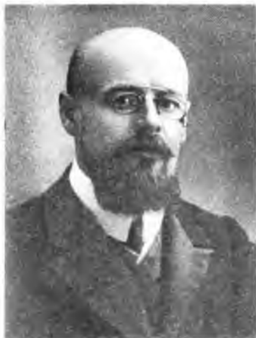
В.М.Пуришкевич — один из руководителей монархической организации "Союз Михаила Архангела", депутат II—IV Государственных дум.