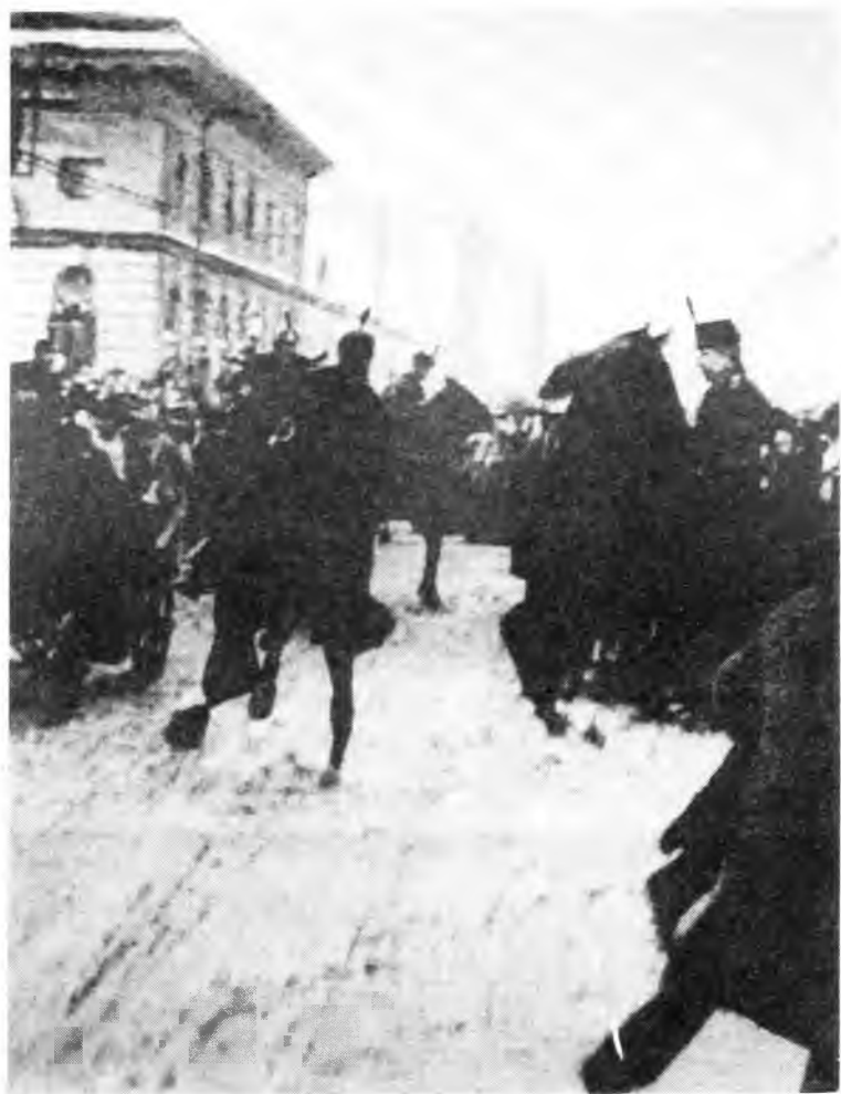
Беспорядки в Петербурге в день роспуска II Государственной думы. 1907 г.