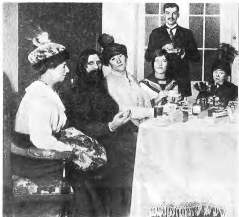
Г.Е.Распутин среди многочисленных поклонниц. 1914—1915 гг.