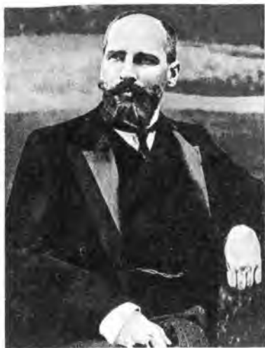
П. А. Столыпин — министр внутренних дел и председатель Совета министров в 1906—1911 гг.