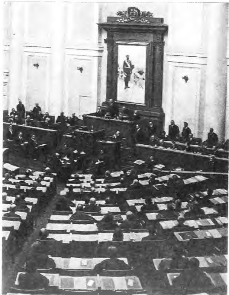
Заседание IV Государственной думы под председательством М.В.Родзянко. 1914 г.