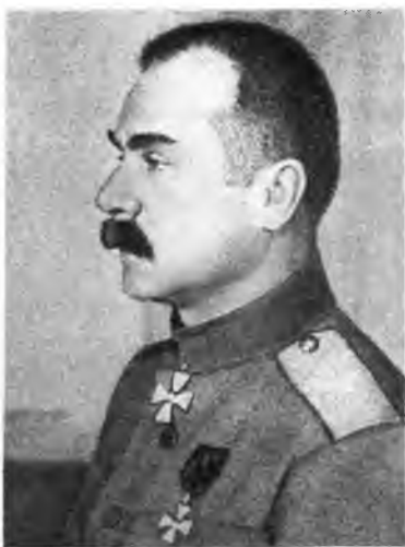
А.М.Каледин — атаман войска Донского в 1917 г.