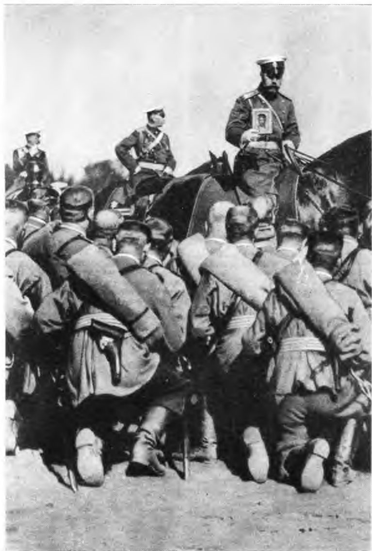
Николай II на фронте в годы первой мировой войны.