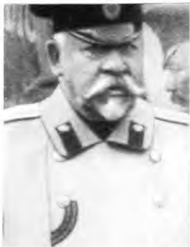
В.А.Сухомлинов — военный министр в 1909—1915 гг.