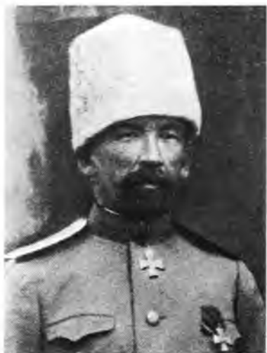
Л.Г.Корнилов — генерал армии, начальник Петербургского военного округа после Февральской революции.