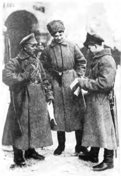
На улицах Петрограда. Февраль-март 1917 г.