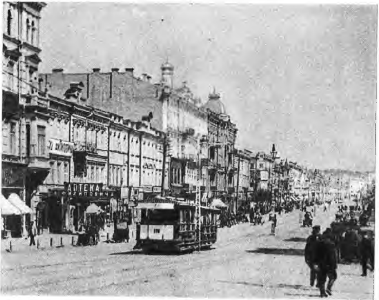
1. Киев. Крещатик в начале века.

Один из номеров газеты "Киевлянин", основанной отцом В.В.Шульгина. Выходила до 1918 г.