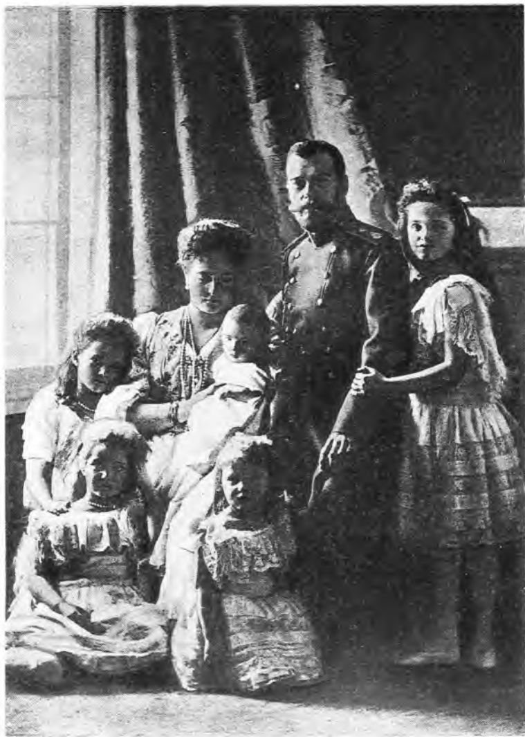
Последний русский император Николай II в кругу семьи. Слева направо: Татьяна, Александра Федоровна с наследником Алексеем, Ольга, Мария, Анастасия. 1905 г.