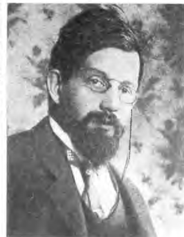
П. Б. Струве — автор манифеста I съезда РСДРП в 1898 г., член ЦК партии кадетов.