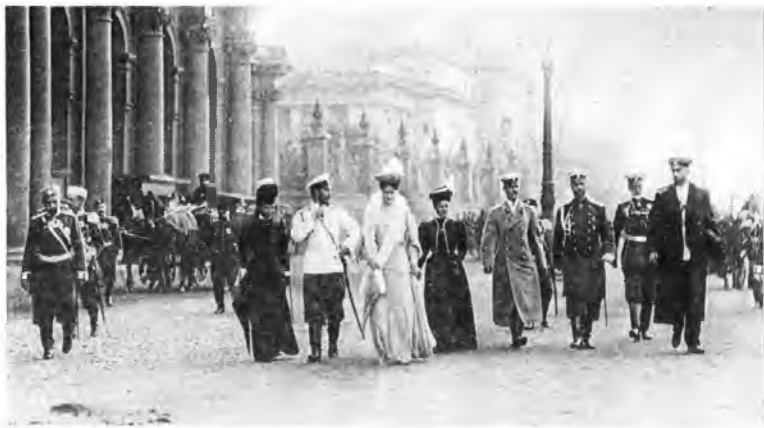
Приезд Николая II на открытие I Государственной думы. 1906 г.