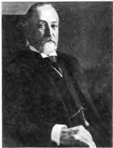
В. Н. Коковцов — председатель Совета министров в 1911—1914 гг.