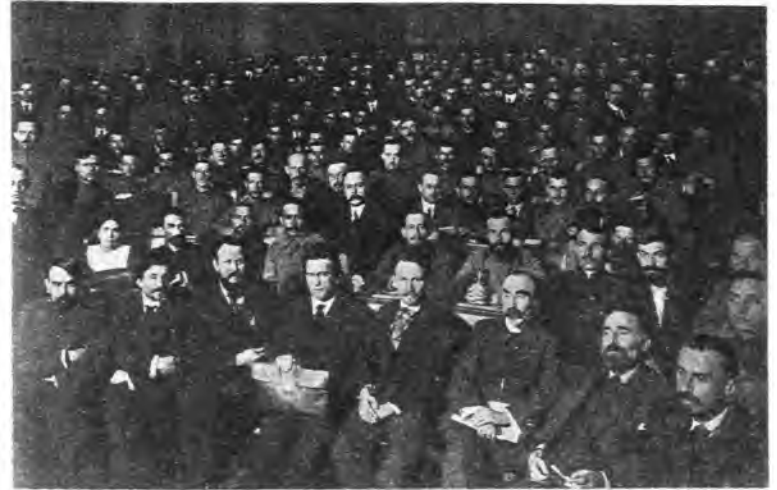
Заседание Совета рабочих и солдатских депутатов в здании Государственной думы. Апрель 1917 г.