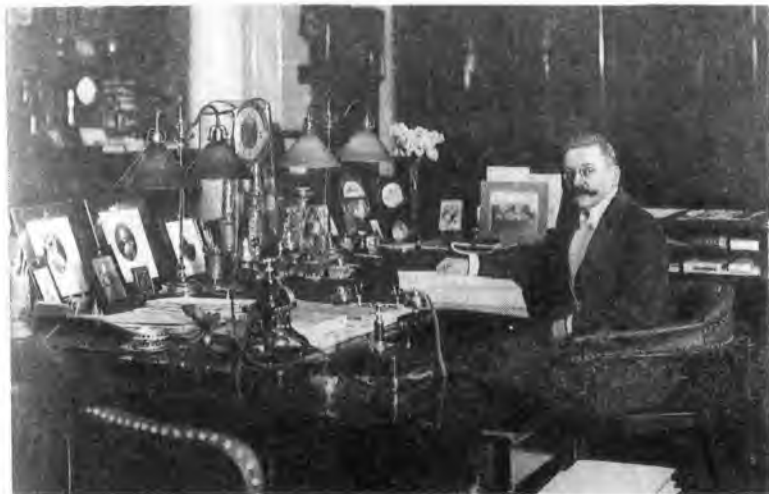
Н.А.Маклаков — министр внутренних дел в 1912—1915 гг.