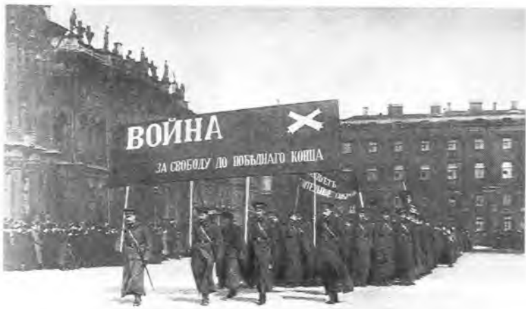
Юнкера на улицахъ Петрограда. 1917 г.

Манифестъ об отреченіи Николая II от престола.