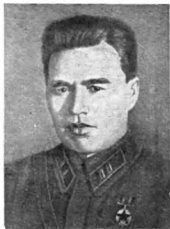
Майор П. М. Гаврилов. 1941 г.