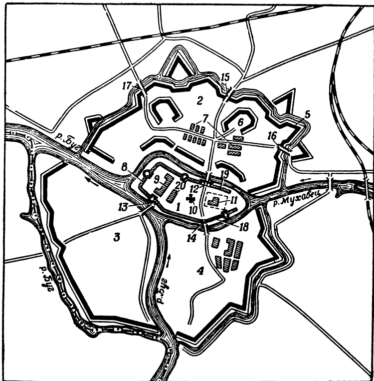
Примерный план Брестской крепости (1941 год)

1 — Центральный остров; 2 — северная часть крепости; 3 — Западный остров; 4 — Южный остров; 5 — земляные валы; 6 — восточный форт; 7 — дома коменданта; 8 — кольцевые казармы; 9 — здание казарм 333-го полка; 10 — здание клуба (бывшая церковь); 11 — Белый дворец; 12 — трехарочные ворота цитадели; 13 — Тереспольские ворота цитадели; 14 — Холмские ворота цитадели; 15 — Северные (главные) входные ворота крепости; 16 — Восточные, или Кобринские, ворота крепости; 17 — северо-западные ворота крепости; 18 — участок казарм 84-го полка; 19 — оборона группы Фомина и Зубачева в последние дни июня; 20 — здание погранзаставы.