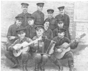
Группа пограничников Брестской крепости

решение... Ворвавшись в камеру, автоматчики нашли там три трупа — молодой боец уничтожил обоих шпионов, а потом выстрелил себе в сердце.