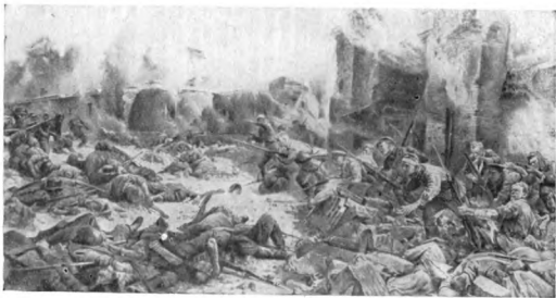
Защитники Брестской крепости