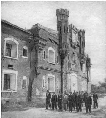
Холмские ворота Брестской цитадели

Но к этому времени возникло другое обстоятельство, которое и решило окончательно судьбу крепостей.