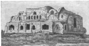
Развалины гарнизонного клуба (бывшей церкви)

Войдя во двор цитадели, немцы сразу же оценили все выгоды этого здания и поспешили занять его, тем более, что клуб был пуст, — в минуты первоначаль-