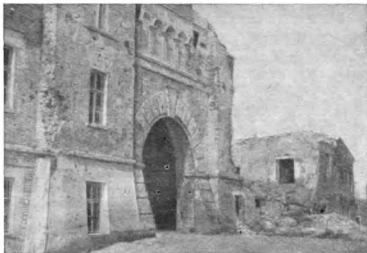
Развалины Тереспольских ворот цитадели

же летом 1915 года немцы предприняли наступление на Восточном фронте и подходили к Бресту, большая часть складов была вывезена, а войска, находившиеся в то время в цитадели, по приказу командования взорвали часть фортов и отошли без боя, оставив крепость противнику. С тех пор и до конца войны Брестская крепость находилась в руках немцев, и именно здесь в 1918 году был подписан тяжелый для молодой Советской республики Брестский мир.