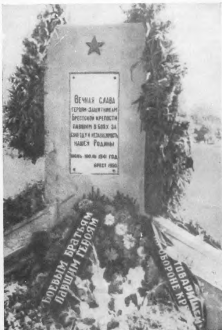
Памятник на братской могиле героям обороны в Бресте.