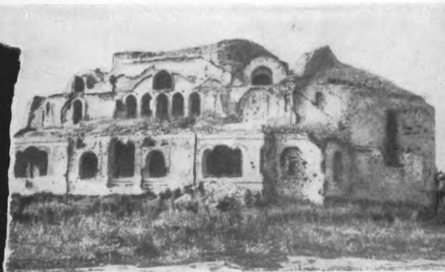
Здание гарнизонного клуба (бывшая церковь).