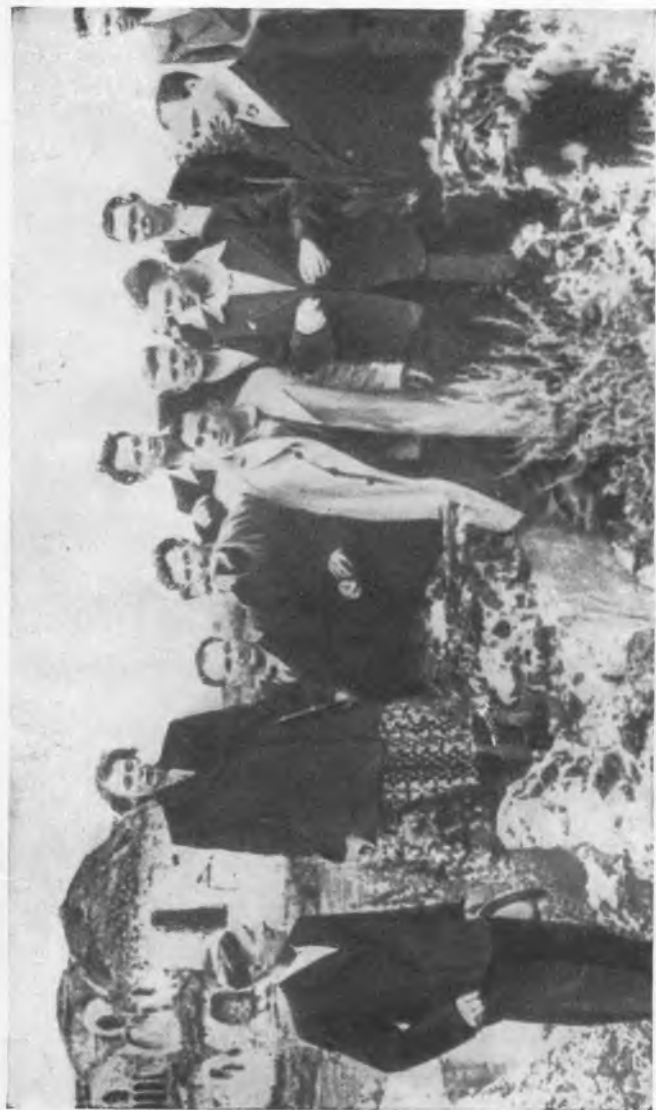
На памятных развалинах.