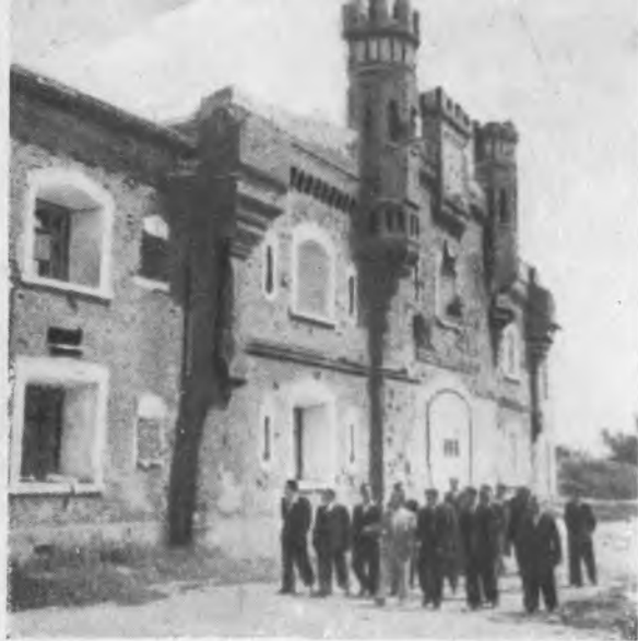
Холмские ворота цитадели.