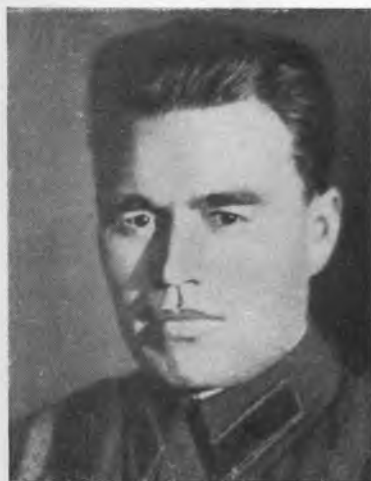
Майор П. М. Гаврилов (1941 г.).