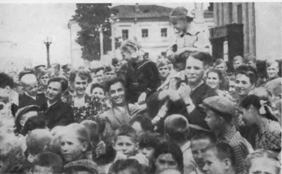
В Минске. Участники обороны Брестской крепости встретились с пионерами.