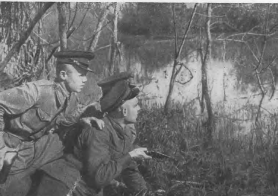
Пограничники на Западном острове крепости (1941 г.).