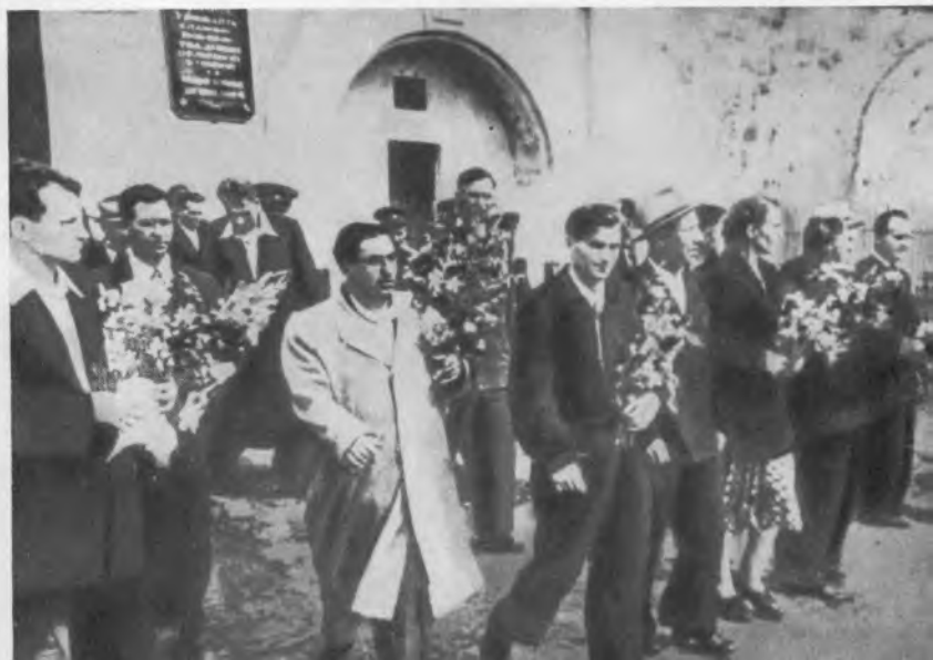
Герои обороны входят в Брестскую крепость.