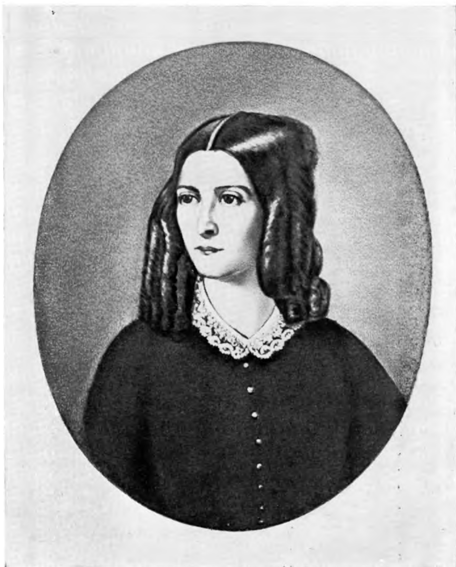
А. О. СМЕРНОВА