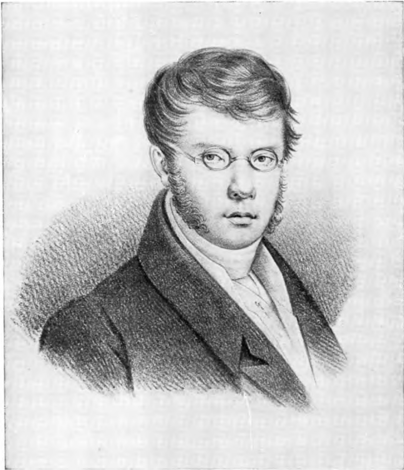
П. А. ВЯЗЕМСКИЙ

Литография с рисунка И. Е. Вивьена. 1820-е годы Государственный музей А. С. Пушкина, Москва