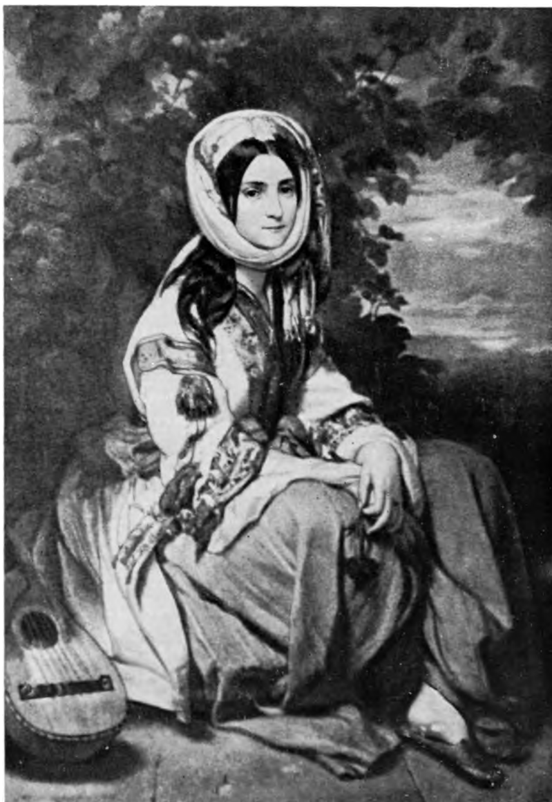
А. О. СМІРНОВА В МАСКАРАДНОМ КОСТЮМЕ Портрет маслом работы Ф.-К. Винтергальтера. 1837 Литературный мемориал Смирновых в Тбилиси