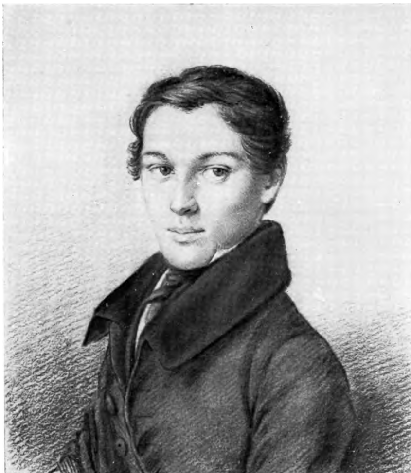
Н. Д. КИСЕЛЕВ

Акварель неизвестного художника. Бумага. 1830-е годы Всесоюзный музей А. С. Пушкина. Ленинград