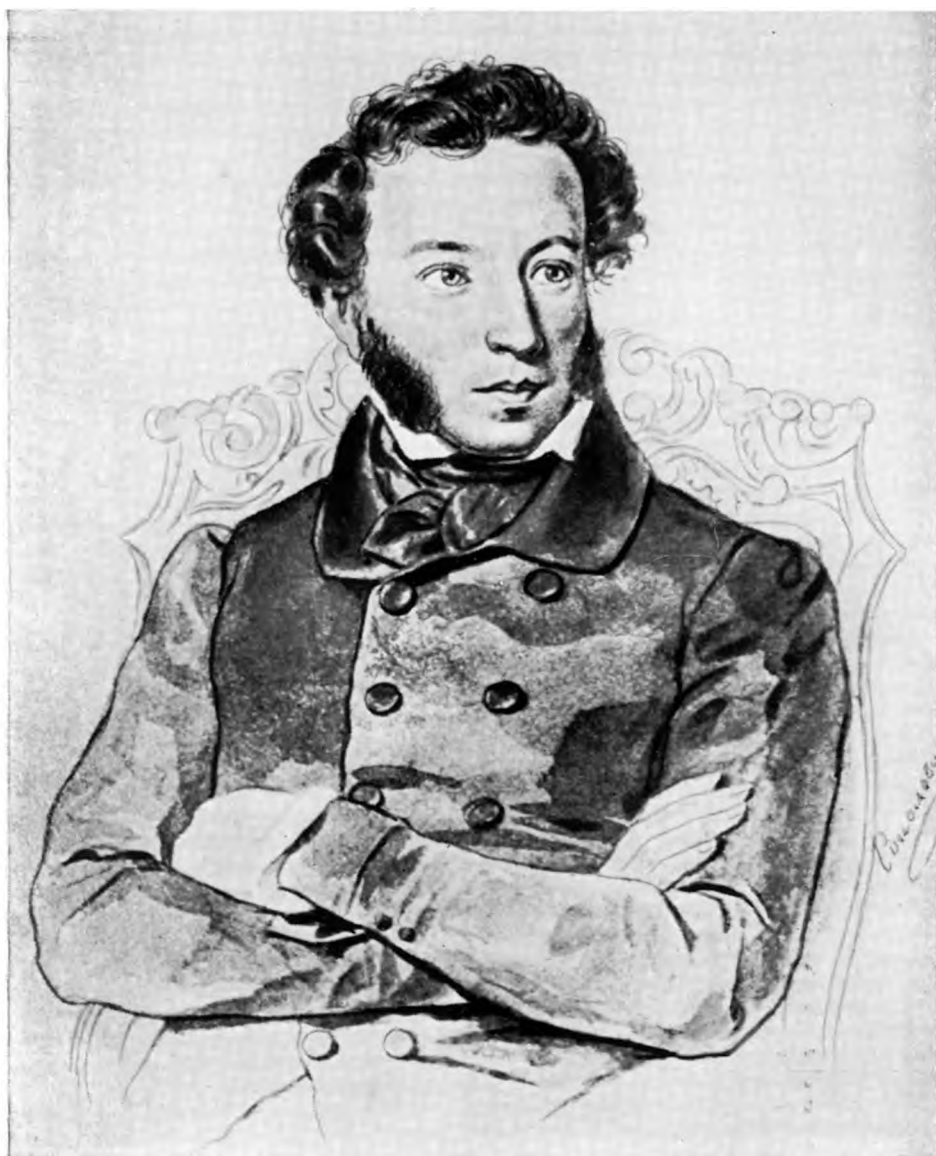
А. С. ПУШКИН Акварель П. Ф. Соколова. 1836 Всесоюзный музей А. С. Пушкина. Ленинград