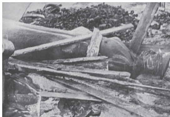
8. На воркутинской свалке (стр. 445)