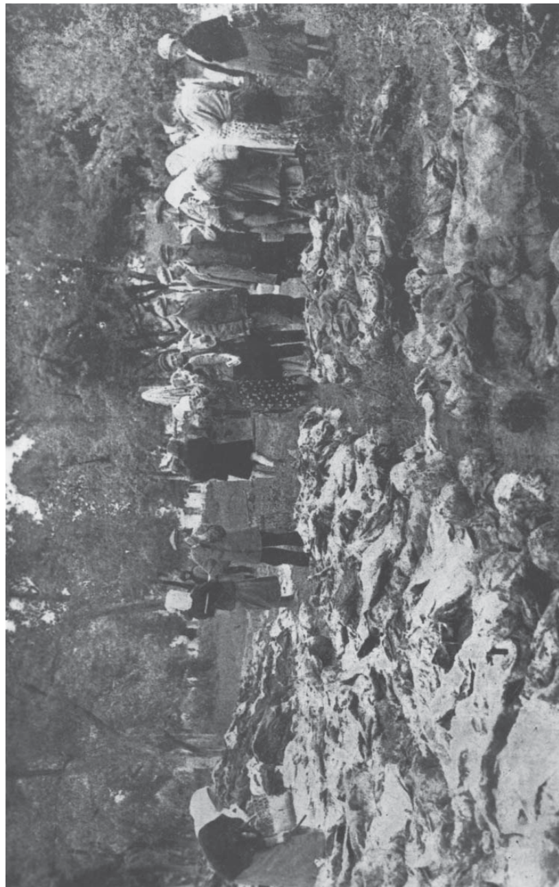
1. Расстрелянные в Виннице (стр. 17)

Как великолепно оправдалась злодейская затея Архипелага!