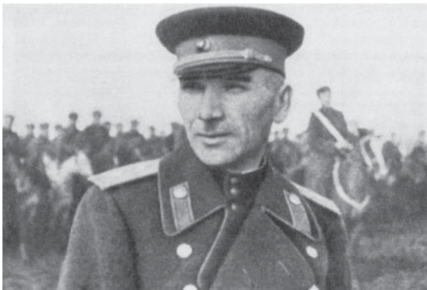
9. Генерал Плиев (стр. 483)