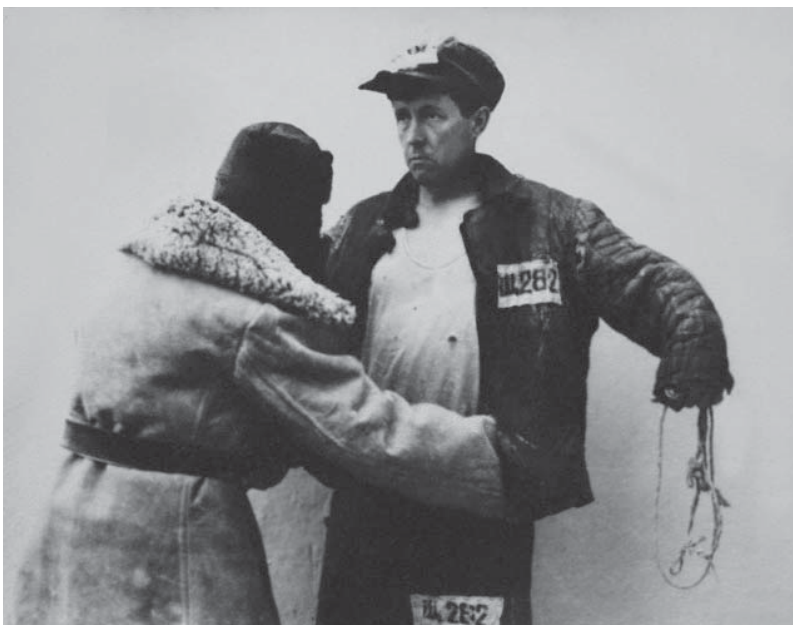
2. Обыск на проходе (стр. 60)