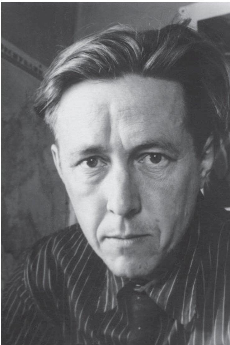
Ссылка. Кок-Терек, 1955