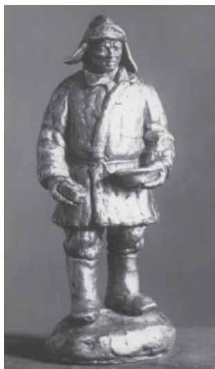
7. Скульптура Л. Недова (стр. 441)