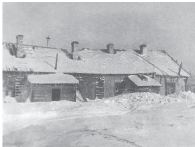
6. Барак ВГС (стр. 402)