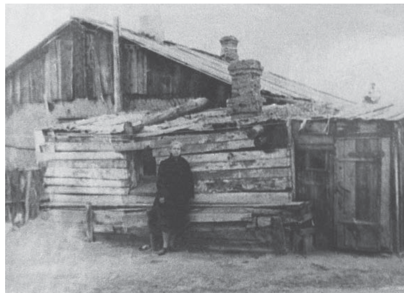
5. Суровцева около хибарки (стр. 402)