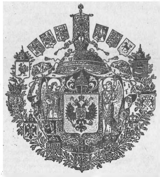
Всероссийский Государственный герб.