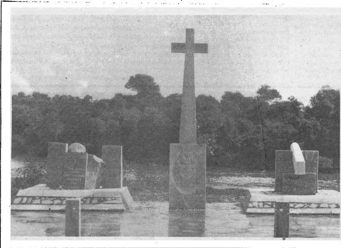
Екатеринодар. Сентябрь 1992 г. Памятник генералу Л.Корнилову, созданный усилиями редакции и читателей журнала «Кубанец» (США) и их представителей на Кубани. Скульптор В.Слинько.