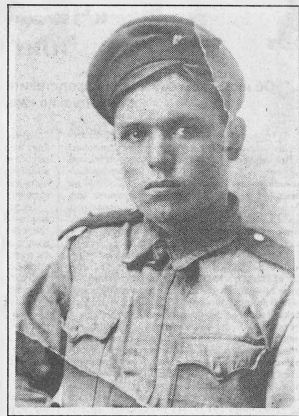
1942 г. Ушел в 1942 г. в корпус фон Панвица

Есть в публикациях в «Станице», на мой взгляд, неточности. Там идет разговор о 70 тысячах пострадавших казаков, а только в нашем корпусе более ста тысяч, в корпусе Доманова почти столько же, а еще корпус Краснова приплюсуйте. Да 5-ый запасной полк - это еще двенадцать сотен. Были там кубанцы, терцы, алтайцы, калмыки, горцы разные и другие. Ту же участь вместе со своими детьми разделили белоэмигранты, придерживающиеся казаков.