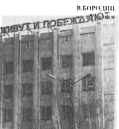
Уральский обком бывшей компартии, а теперь соцпартии

Сограждане! Будьте осторожны! Последний отряд «динозавров» ХХ века вышел на тропу.