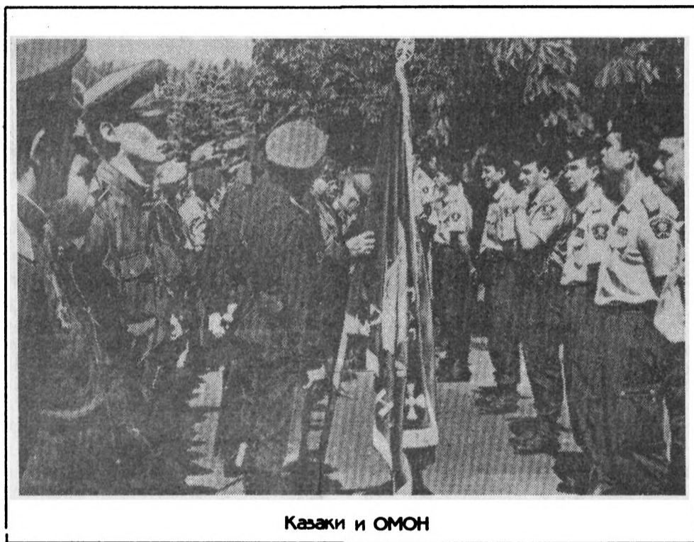
Казачи и ОМОН

словно-этнической общностью, способной сплотить вокруг себя все патриотически, государственно мыслящие силы страны, поставив их на службу не отдельным партиям или личностям, а делу возрождения России и ее армии. В дореволюционной России идеи патриотизма были распространены в среде духовенства и дворянства, национальной буржуазии и купечества, казачества и зажиточного крестьянства. В сегодняшней России положение иное: духовенство пока не имеет былого воздействия на умы людей, дворянство и зажиточное крестьянство отсутствуют, большинство отечественных предпринимателей и «купцов» дискредитировали себя откровенным грабежом народного достоинства и вывозом капиталов за границу. Только казачество, приступившее к созданию своих армейских подразделений и частей, взявшее под охрану госграницу, не на словах, а на деле демонстрирующее служение России на самых трудных и ответственных участках, может стать носителем идеи всеобъемлющего державного патриотизма. Патриотически настроенная молодежь и кадровое офицерство, решившее посвятить себя службе в казачьих войсках, будут основным «человеческим материалом», подпитывающим потомственное казачество.