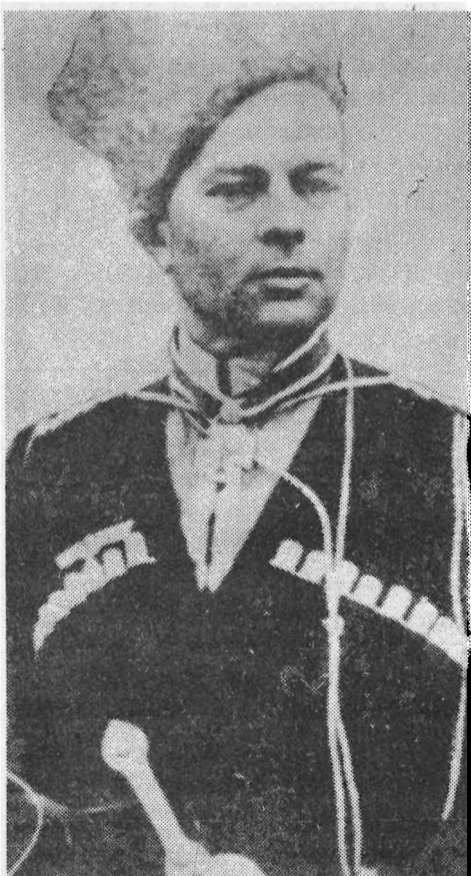
Генерал Г. фон Паннвиц

Генерал А. Деникин Бывший главнокомандующий русскими армиями 1917 — 1920 гг.»