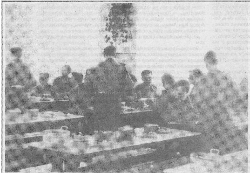
Кадеты обедают.

В.П.Ищенко "Наше время" Рост. область № 70 18 апреля 1996г.