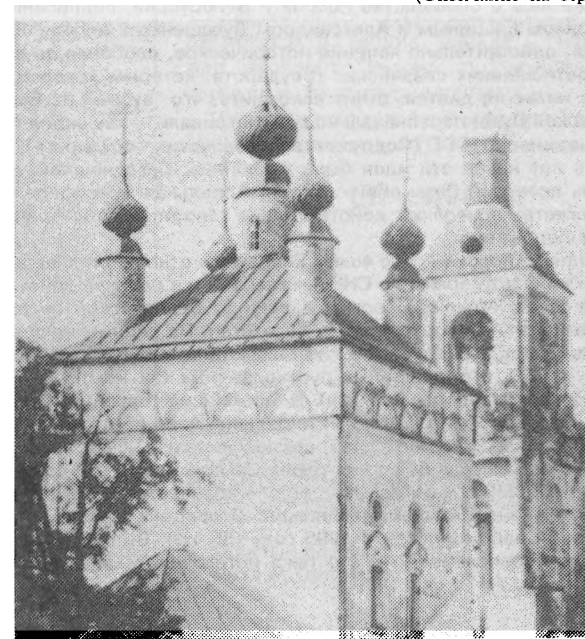
Самый старый собор Уральска — Храм Михаила Архангела.