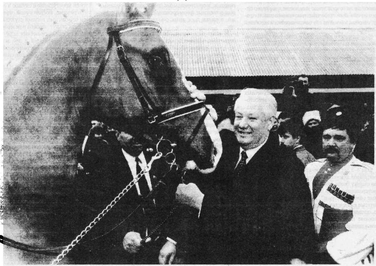
Встреча Президента с Кубанскими казаками во время визита в Краснодарский край. Апрель 1996 г.