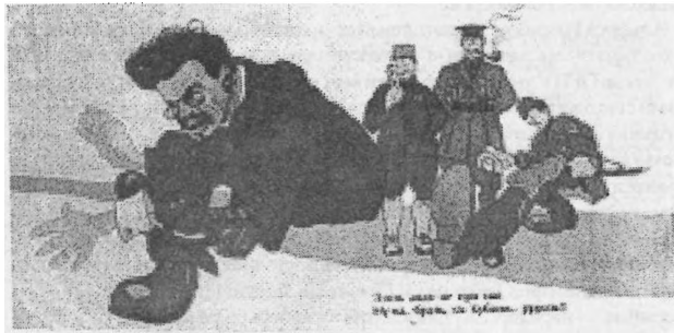
Плакат «Изгнание Троцкого из Кубани» Цветная литография. Ростов-на-Дону, 1917 г.

По-существу, этот номер бюллетеня подвел итоги работы ГУКВ на момент его расформирования, итоги целого этапа возрождения казачества - этапа начального становления его государственных структур, формирования Госреестра казачьих обществ. В бюллетене приведены сведения о госструктурах, занимающихся работой с казачеством, соответствующих подразделениях в субъектах РФ, материалы по Госреестру казачьих обществ (с картой их местонахождения), распоряжения и указы Президента РФ, нормативные правовые акты по казачеству субъектов РФ, различная информация и подготовленные ГУКВ рекомендации по работе казачьих обществ, материалы по сотрудничеству с Русской Православной Церковью, сведения о научно-исследовательских центрах и изданиях России по казачеству, фотографии из зарубежного архива, исторические воспоминания и впервые публикующиеся в прекрасном цветном исполнении документы и иллюстрации Донского казачьего архива, входившего в Русский заграничный исторический (т.н. «Пражский») архив.