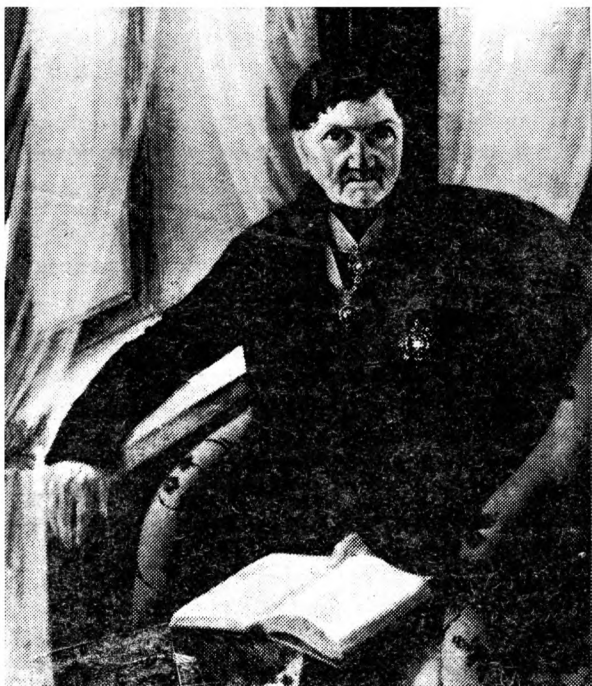
И. Б. ПЕСТЕЛЬ. Начало 1840-х гг. Неизвестный художник первой половины XIX в.

шею существенною доверенностию. Это случилось в начале 1806 года.