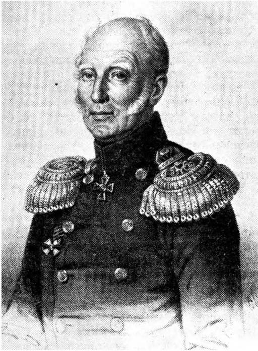
П. И. РИКОРД

казалось, что замечаниями моими намеренно ослабляю выражения автора статьи, служащие к превознесению заслуг покойного, тому скажу только, что во время самого ужасного кризиса моей жизни рука Петра Ивановича не дрогнула написать ко мне официальную записку: «Любезный друг, не беспокойся о детях, я буду наблюдать их» 3 .— К делу.