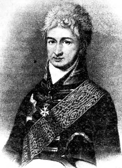
Н. П. РЕЗАНОВ