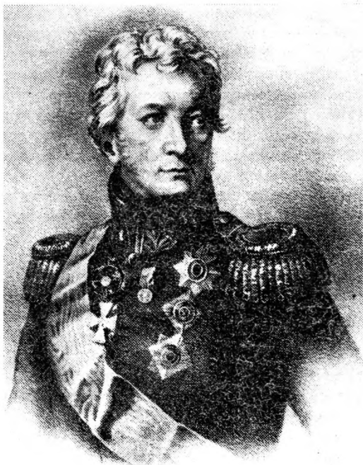
А. П. ТОРМАСОВ

Бендер; при разбитии неприятеля за Дунаем близ Бабая и во многих других делах, из коих в Мачинском, командуя кавалериею левого фланга, он оказал толь отличную храбрость, что в 1790 году за оную награжден от императрицы военным орденом св. великомученика Георгия 3 класса — и вскоре произведен генерал-майором. По окончании Турецкой войны граф А. П. Тормасов прослужил всю кампанию против польских конфедератов 4 . Во время оной, командуя отдельным корпусом, за удачно совершенную переправу чрез реку Буг, при местечке Бороусте, в 1792 году получил от короля польского ордена Белого Орла и св. Станислава. В 1794 году за отличную храбрость в известном сражении при местечке Мацевичи награжден от государыни орденом св. равноапостольного князя Владимира 2-й степени; а в пражском штурме заслужил шпагу, алмазами украшенную, с надписью за храбрость. Будучи главнокоманду-