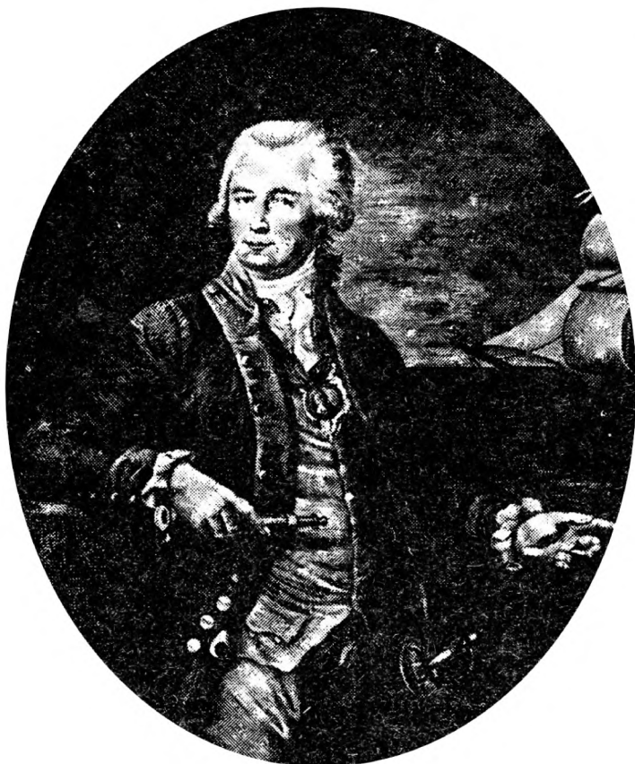
Г. И. ШЕЛИХОВ