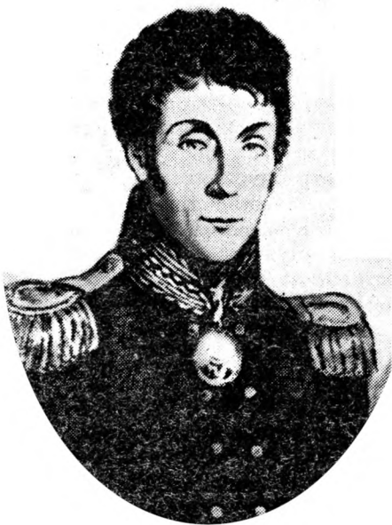
А. А. АРАКЧЕЕВ

чательные, вполне соответствующие потребности создать новый порядок администрации на совершенном уничтожении старого, коллегиального.