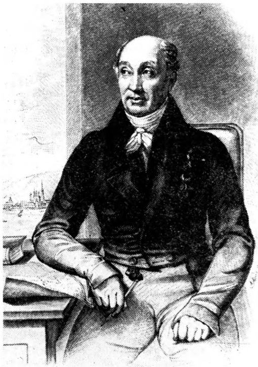
М. М. СПЕРАНСКИЙ

Гравюра на дереве К. Аддега. 1825 г. ИРЛИ