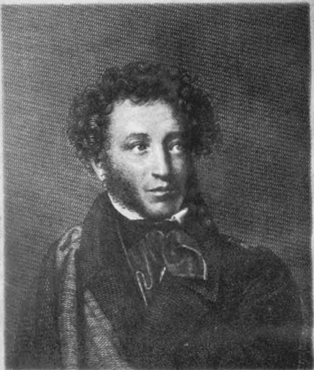
Плат. О. Книженской... 1847.