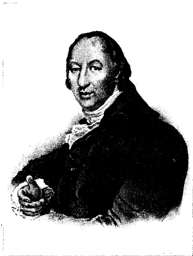
Н. И. НОВИКОВ

книг.— М. Ш. ) быть падеялись?... Уставы ваши позволяют ли иметь с неприятелями государства переписку?.. Кто были в сем участники?.. В чем переписка состояла? Когда