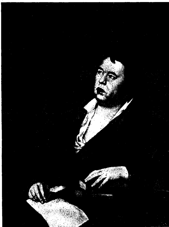
И. А. КРЫЛОВ

котором напечатлены кровью преступления его...»; такие планы могут созреть только в обстановке мрака, «окружающего все помышления его» и скрывающего за собой «преступления, ужас и содрогание» 67 .