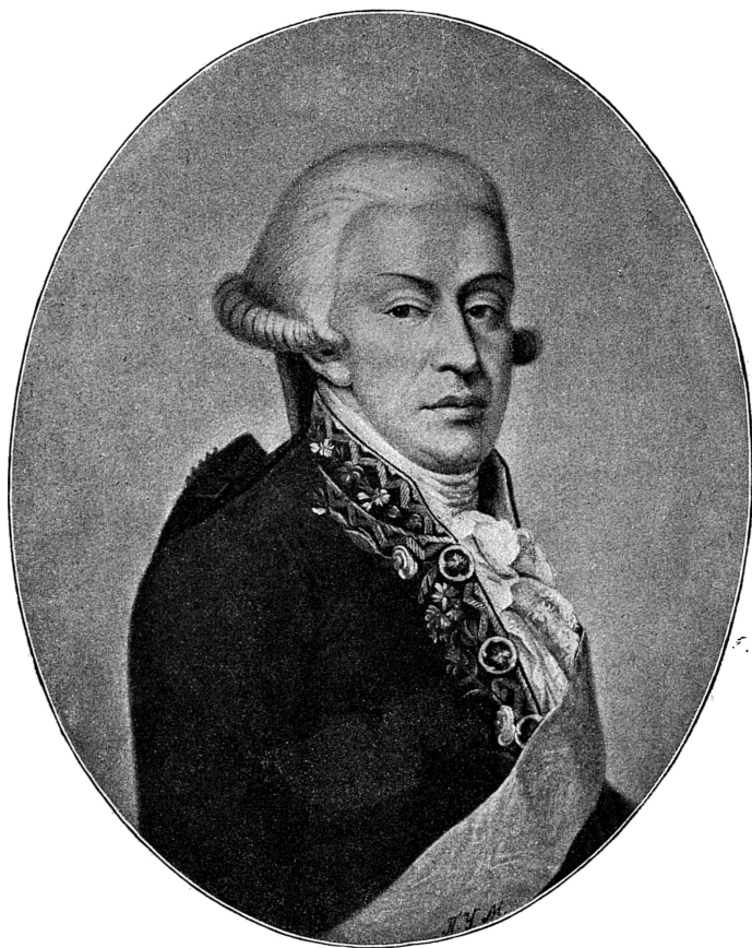
Иванъ Владиміровичъ Лопухинъ.