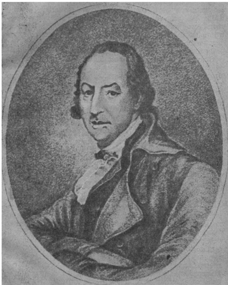
Н. И. Новиков в преклонном возрасте