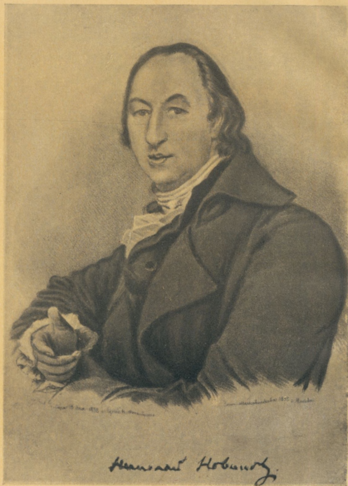
Николай Иванович Новиков Портрет работы художника Д. Г. Левицкого. Начало 1780-х гг.