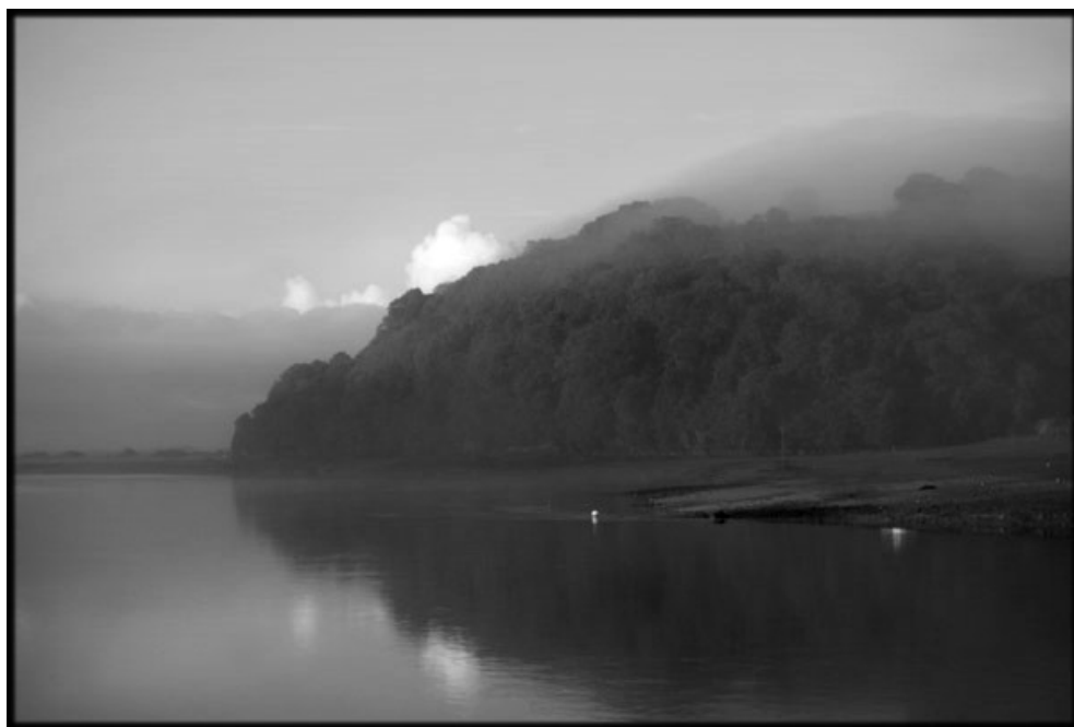
Лохарн. Холм сэра Джона.

Ястреб с виселицы высокой кричит: «Дили-дили, Поди-ка сюда, чтоб тебя убили!»