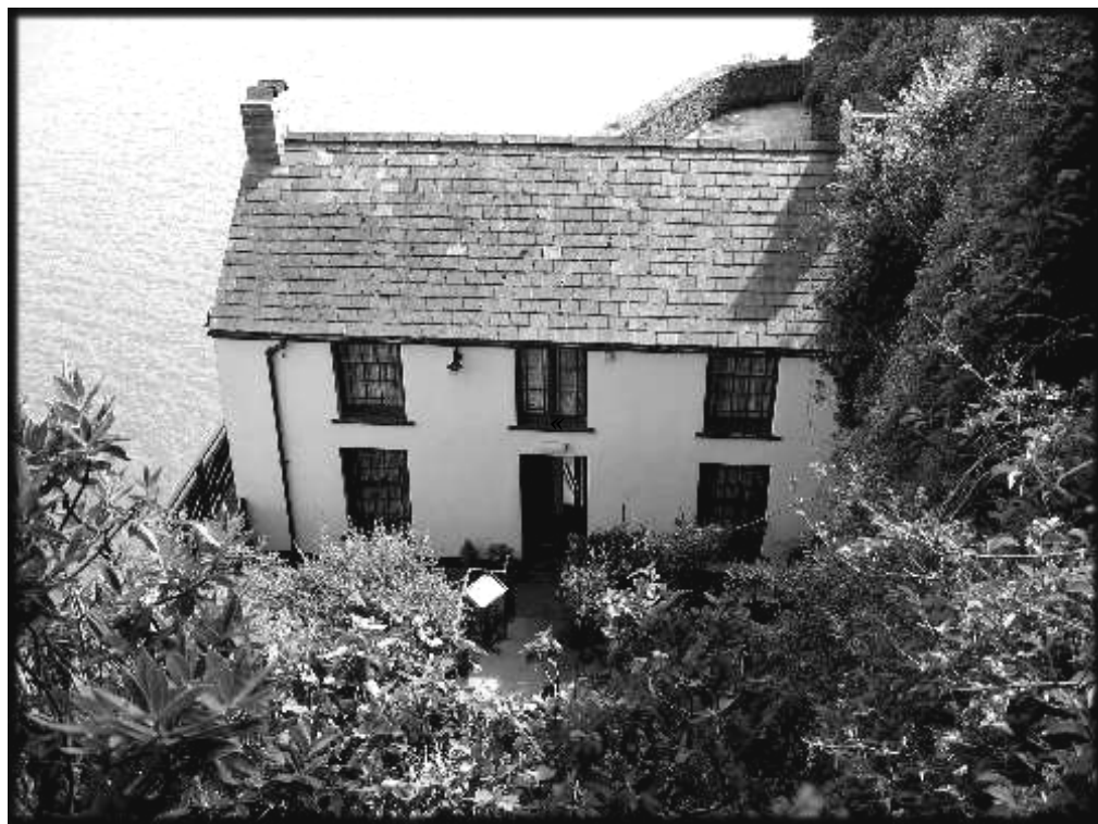
«Дом-корабль» в Лохарне

красок, воли, моря и обязательной гибели. Оно родилось из пейзажа за окном.