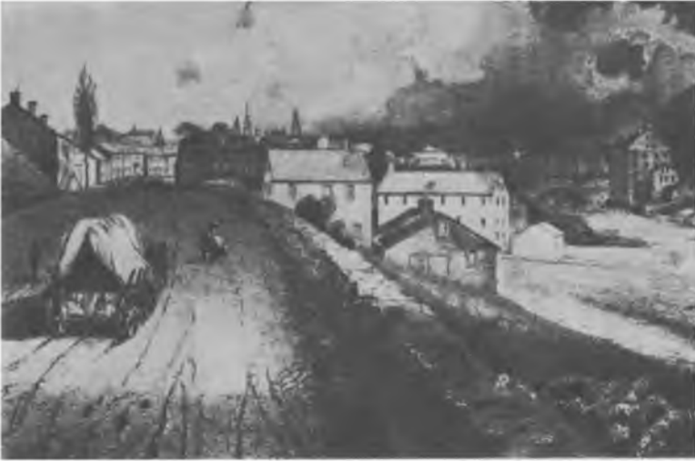
Текстильные фабрики в Потакете, 1835 г.