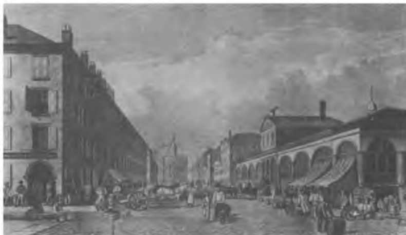
Фултоновский рынок в Нью-Йорке, 1840 г.