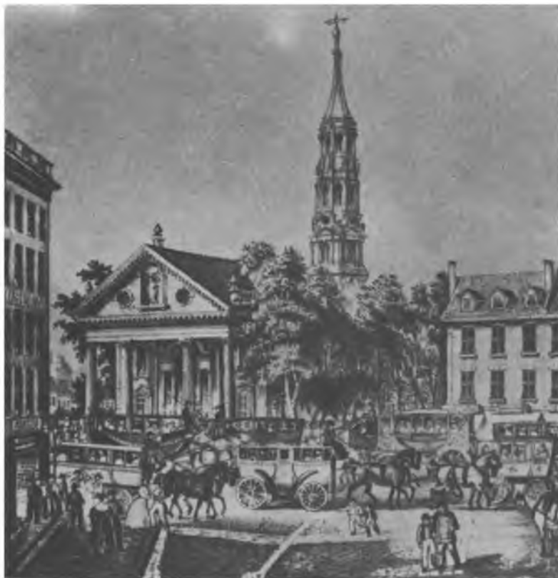
Церковь св. Павла в Нью-Йорке, 1831 г.