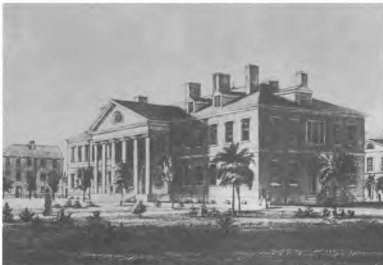
Государственный департамент, 1831 г.