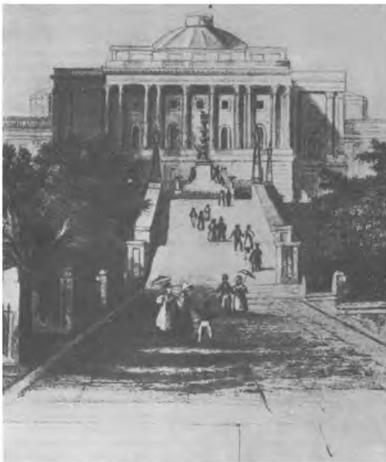
Вид на Капитолий с запада, 1830-е гг.