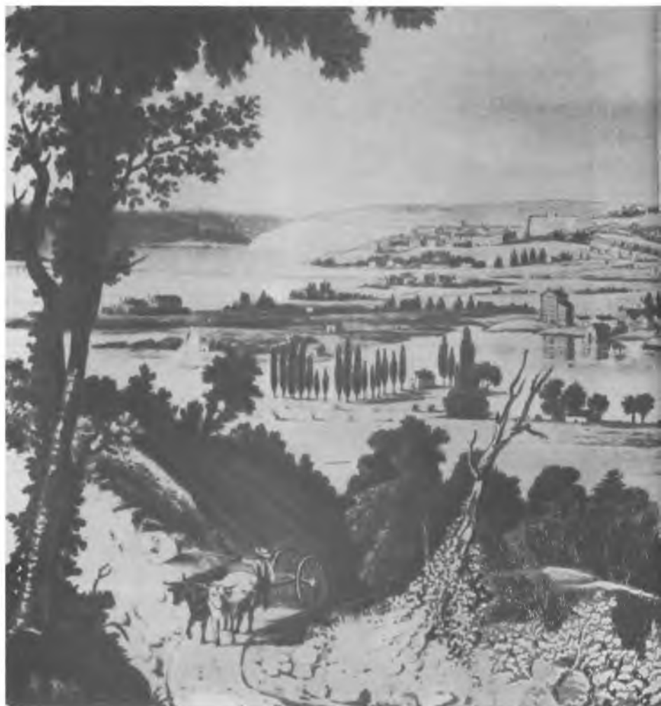
Вашингтонская судоверфь, 1833 г.