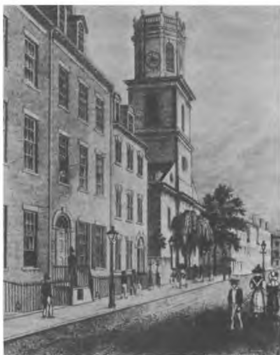
Церковь св. Георгия на Бикман-стрит, Нью-Йорк, 1830 г.