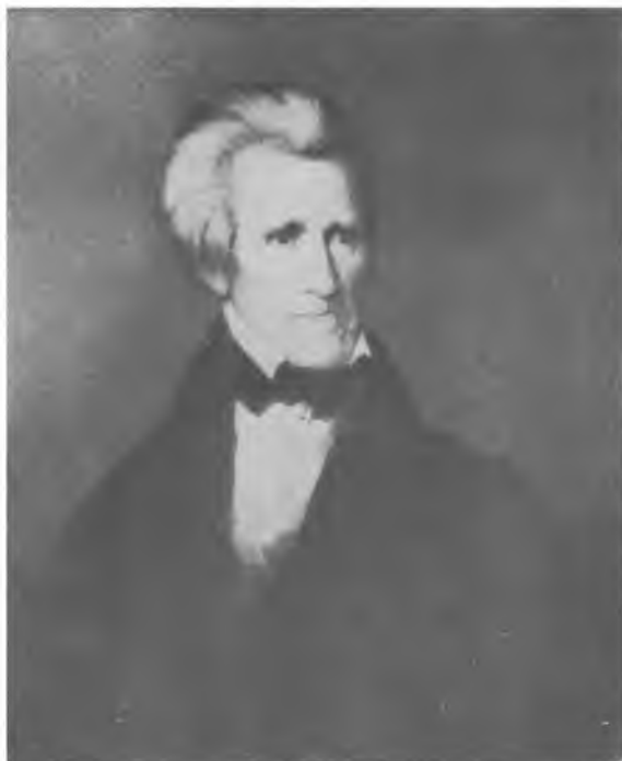
Эндрю Джэксон, президент США в 1829-1837гг. Портрет работы Э.Б.Дюранда, 1835 г.