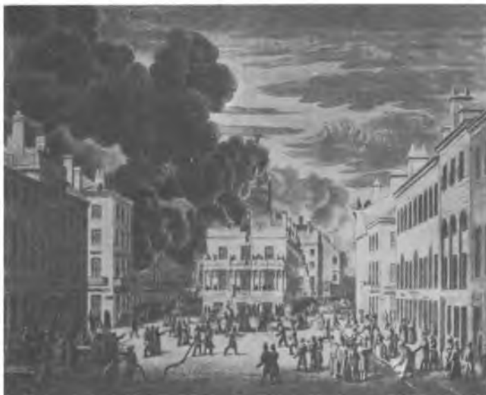
Пожар в Бостоне, 1832 г.