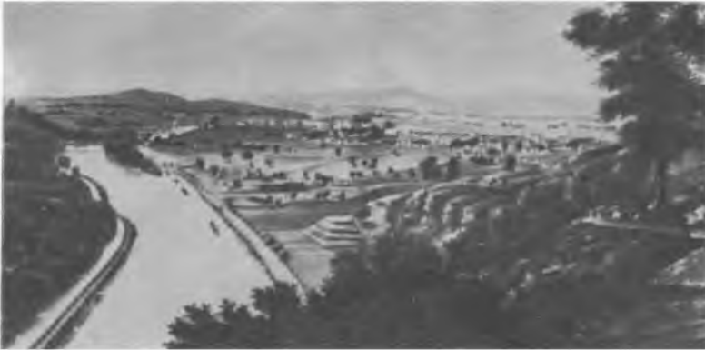
Канал Ридинг, Пенсильвания, 1834 г.