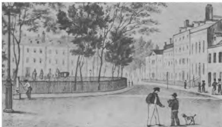
Баулинг Грин, фешенебельная часть Нью-Йорка, 1830 г.