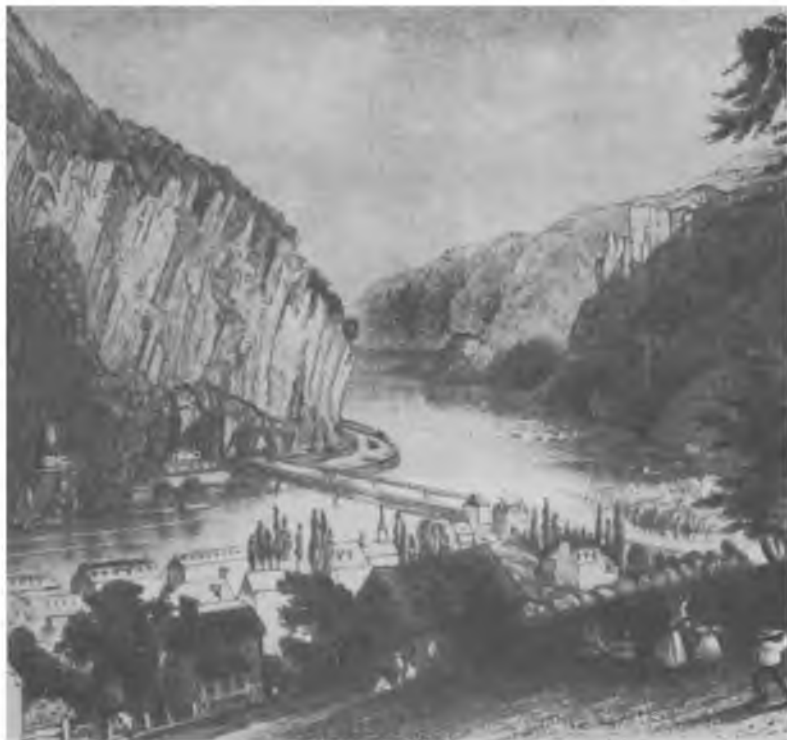
Харперс-ферри, переправа через р. Потомак, 1840 г.