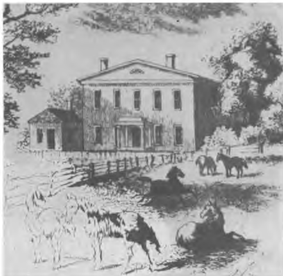
Эрмитаж. Дом Э.Джэксона.