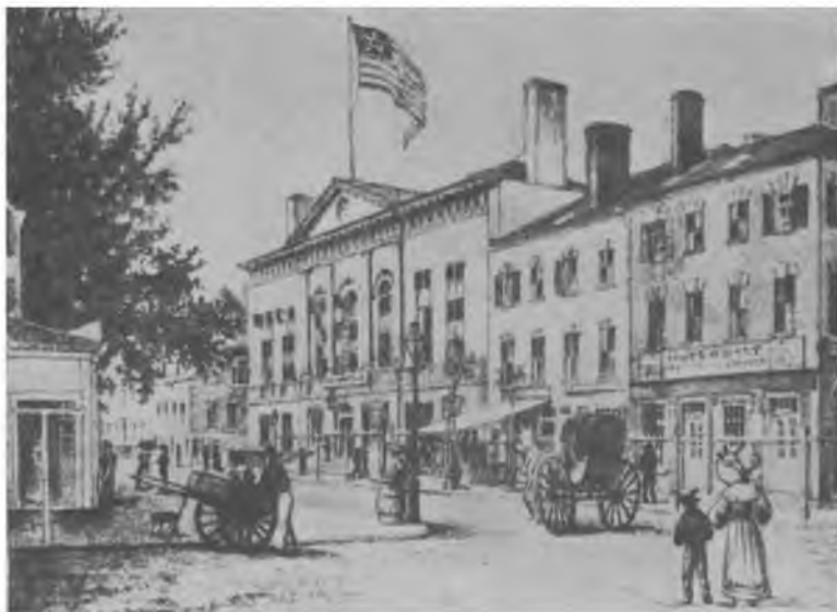
Гостиница «Вашингтон» на Бродвее, Нью-Йорк, 1831 г. Рисунок Ч.Бертонна.