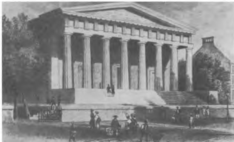
Банк Соединенных Штатов, Филадельфия, 1840 г.