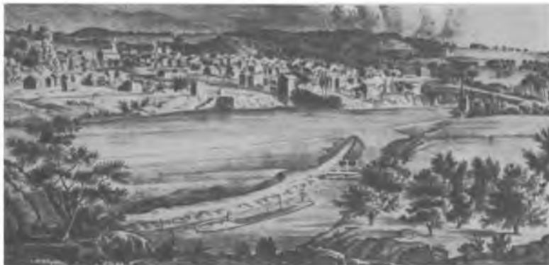
Канал Истон, Пенсильвания, 1831 г.