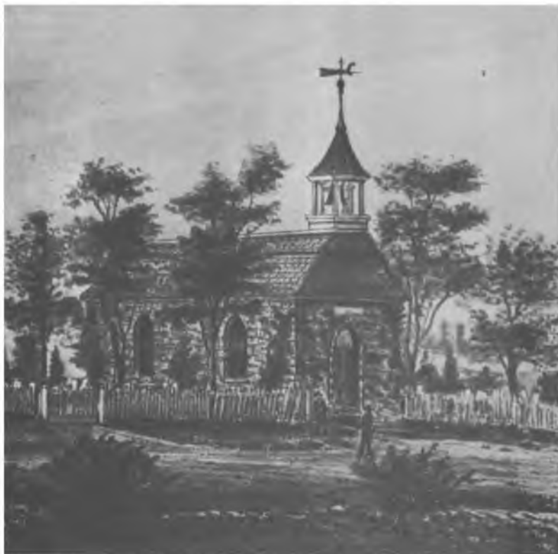
Старая Голландская церковь в Спящей Ложнице.