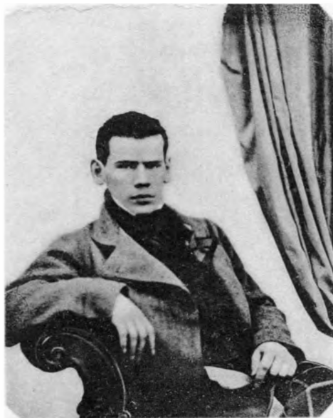
Л. Н. ТОЛСТОЙ 1848 г.