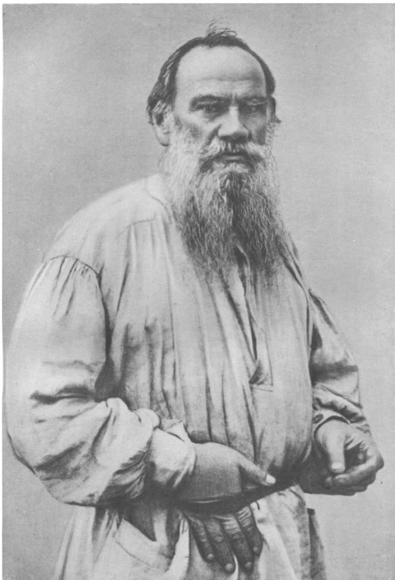
Л. Н. ТОЛСТОЙ в 1891 г.