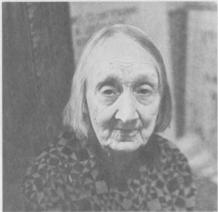
А.И. Цветасва. 1989 г.