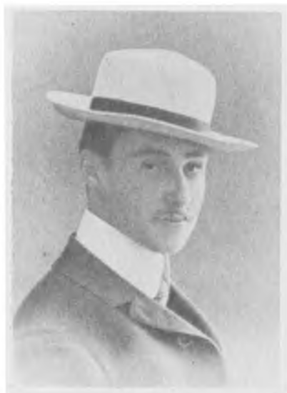
Андрей Иванович Цветаев. 1909 г.