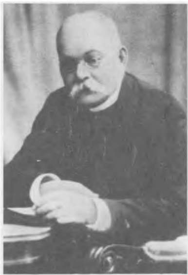
Иван Владимирович Цветаев.