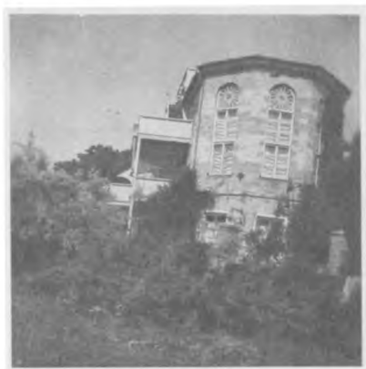
Дом Максимилиана Волошина в Коктебеле. 60-е годы.