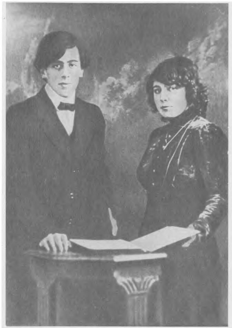
Марина Цветаева и Сергей Эфрон. Свадебная фотография. 1912 г.