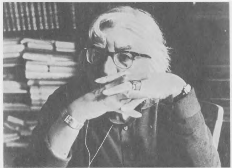
Мариэтта Сергеевна Шагинян.