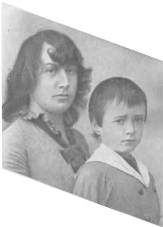
Анастасия Цветаева с сыном Андреем. Крым, 1919 г.