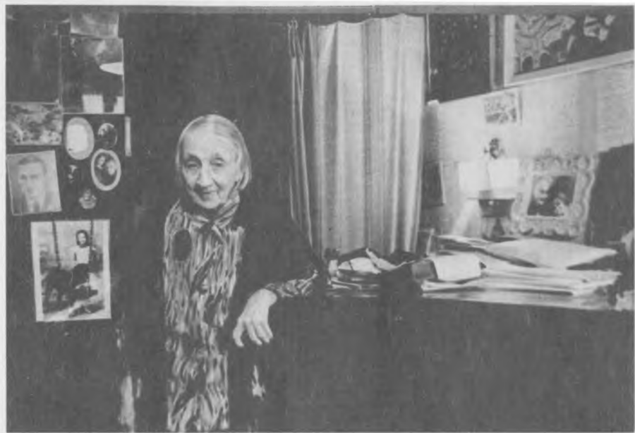
А.И. Цветаева в своей квартире на Большой Спасской. 1989 г.