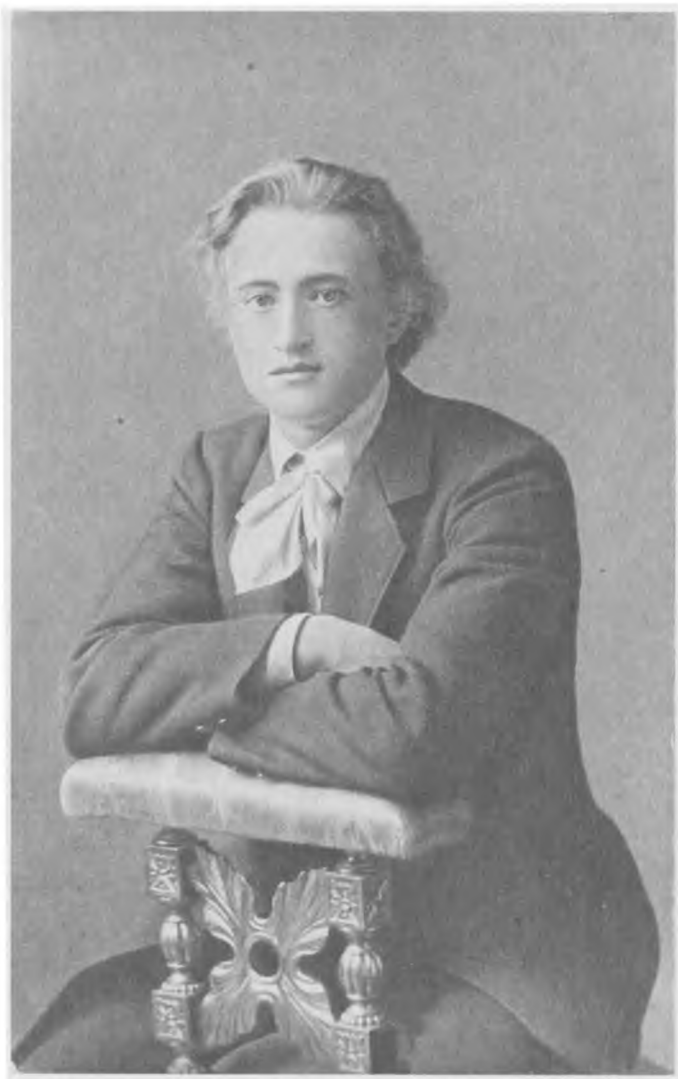
Борис Сергеевич Трухачев. 1911 г.