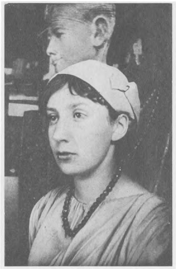
Анастасия Цветаева. Коктебель, 1911 г.