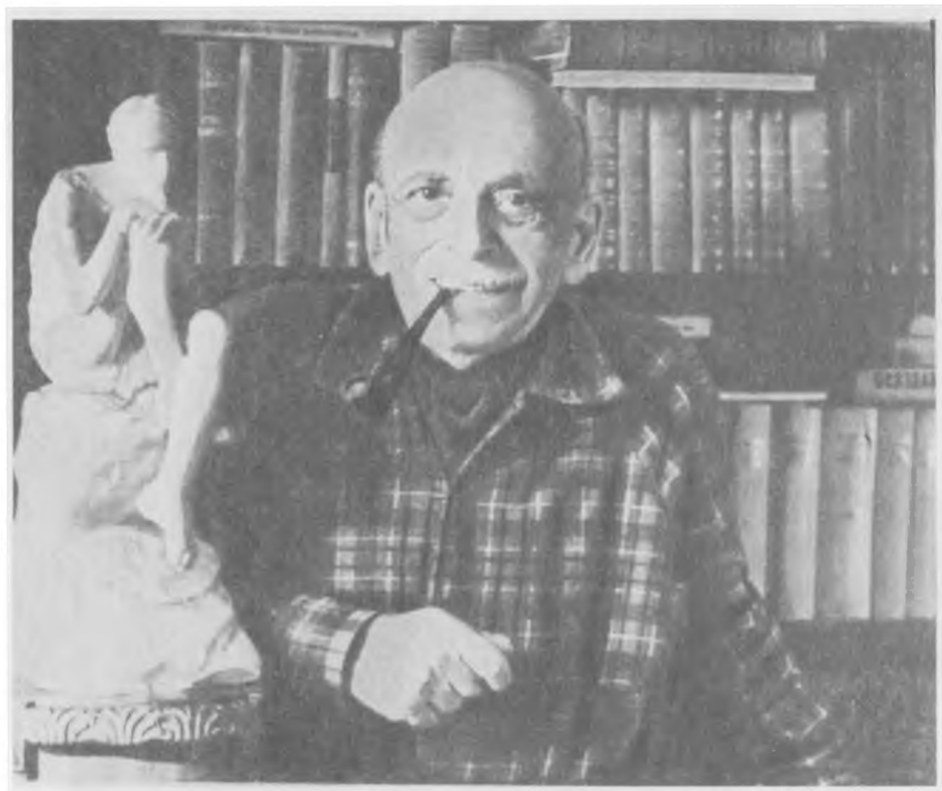
Павел Григорьевич Антокольский.