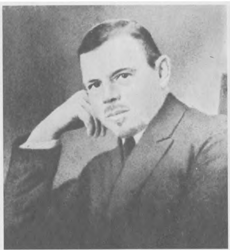
Пантелеймон Сергеевич Романов.