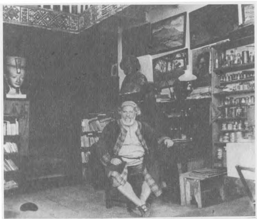
Максимилиан Александрович Волошин в своей мастерской. Коктебель, 1928 г.