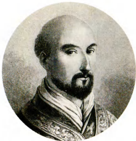
Игнатий Лойола (1491?–1556) — основатель ордена иезуитов. Худ. Гедан