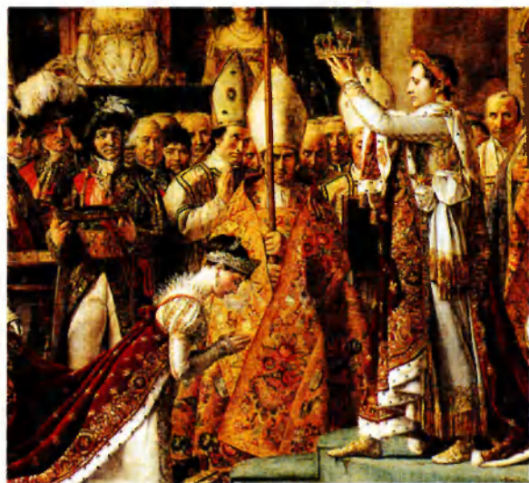
Коронация Наполеона в соборе Нотр-Дам. 1805–1807. Худ. Ж.-Л. Давид