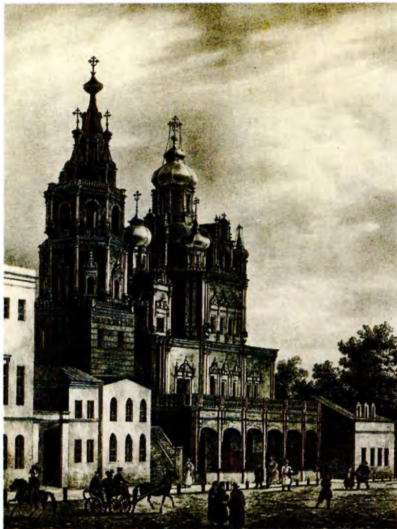
Храм Успения на Покровке вблизи московского дома Тютчевых. 1830-е гг. Худ. О. Кадоль