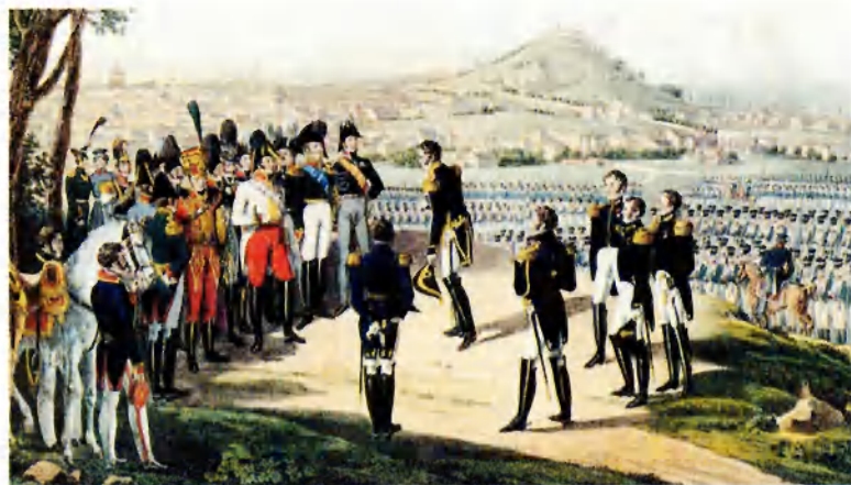
Каштуляция Парижа 31 марта 1814 г. Первая четверть XIX в. Неизв. худ.