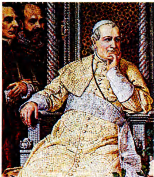
Пий IX (1792–1878) — папа римский с 1846 г.