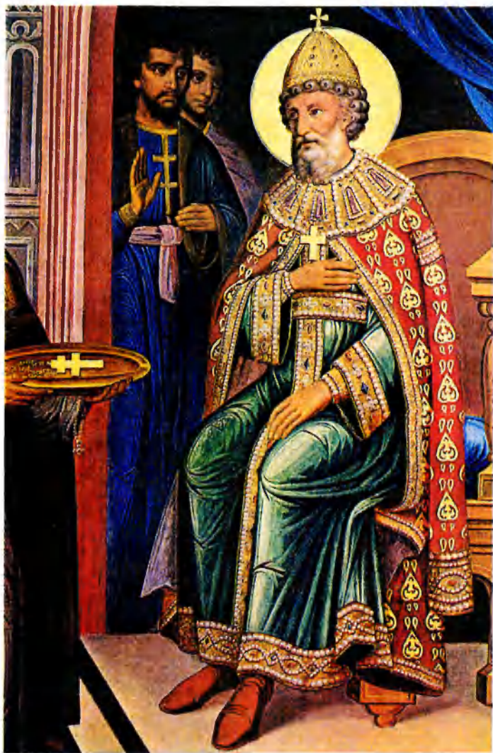
Великий князь Киевский Владимир Мономах принимает знаки императорской власти. 1890-е гг. Роспись Грановитой палаты