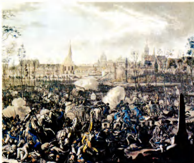
Сражение при Лейпциге 16–19 октября 1813 г. Первая четверть XIX в. Худ. Д. Вагнер