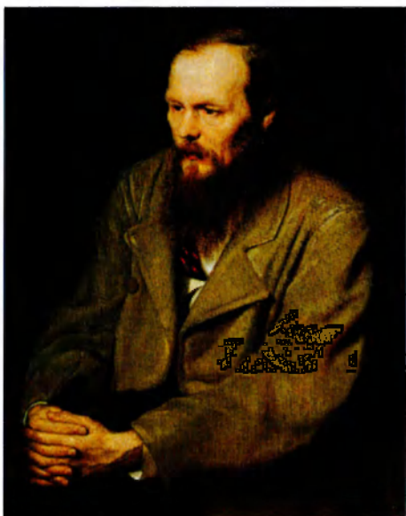
Федор Михайлович Достоевский. 1872. Худ. В. Г. Перов