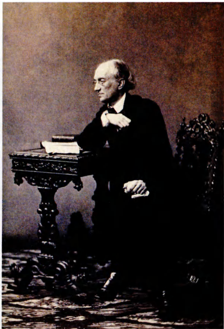
Федор Иванович Тютчев. 1860–1861.