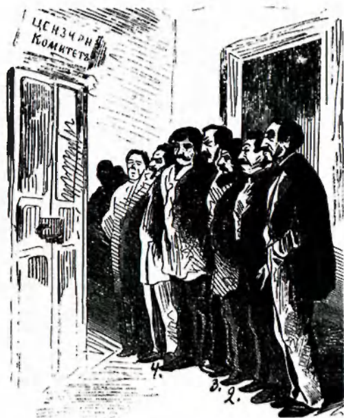
Редакторы отстаивают свои статьи в цензурном комитете. Карикатура из журнала «Искра». 1867