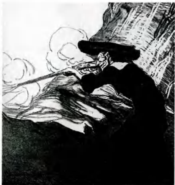
Испания. Любовь к ближнему по-христиански. 1872. Худ. О. Домье