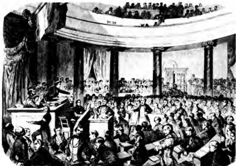
Открытие Франкфуртского парламента 16 сентября 1848 года. 1849. Неизв. худ.