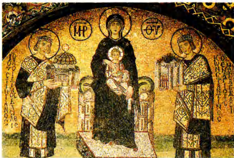
Константин Великий (справа) и Юстиниан (слева) посвящают Богородице Константинополь и храм святой Софии. VI в.