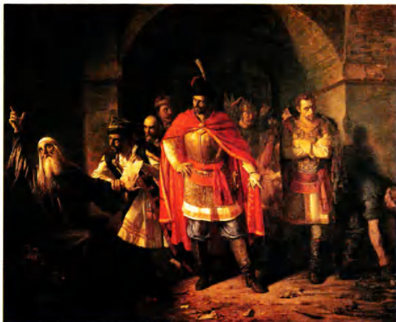
Патриарх Гермоген отказывает полякам подписать грамоту. 1860. Худ. П.П. Чистяков