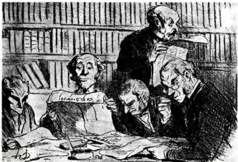
За изучением европейских проблем. 1853. Худ. О. Домье