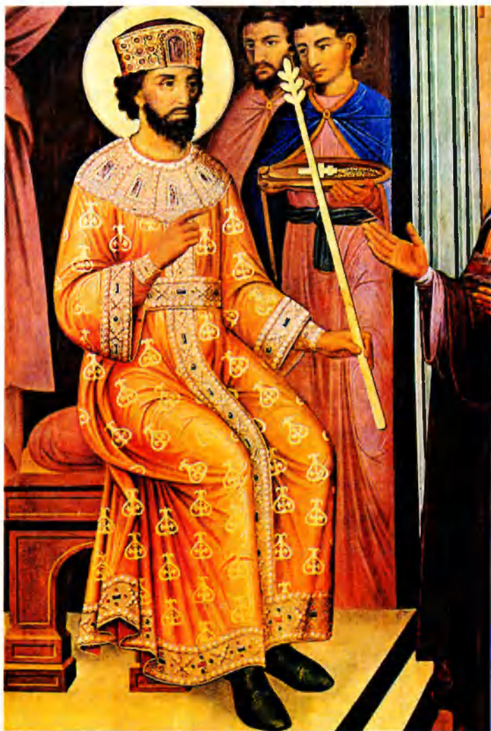
Византийский император Константин IX Мономах посылает знак императорского достоинства своему внуку великому князю Киевскому Владимиру Мономаху. 1890-е гг. Роспись Грановитой палаты