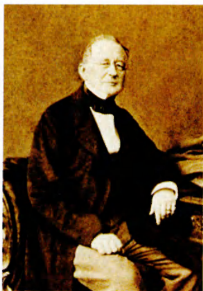
Александр Михайлович Горчаков. Начало 1860-х гг.