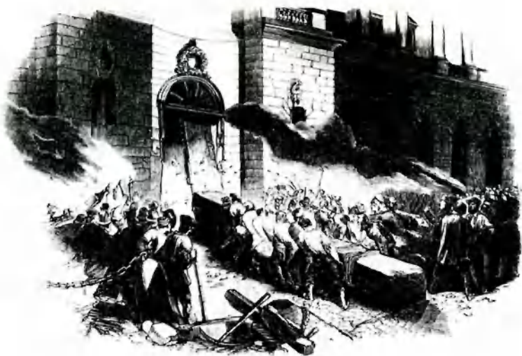
Революция 1848 года в Берлине. Взятие арсенала. 1848. Неизв. худ.