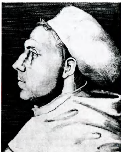
Мартин Лютер (1483–1546) — глава Реформации в Германии — основатель лютеранства. 1521. Худ. Лукас Кранах