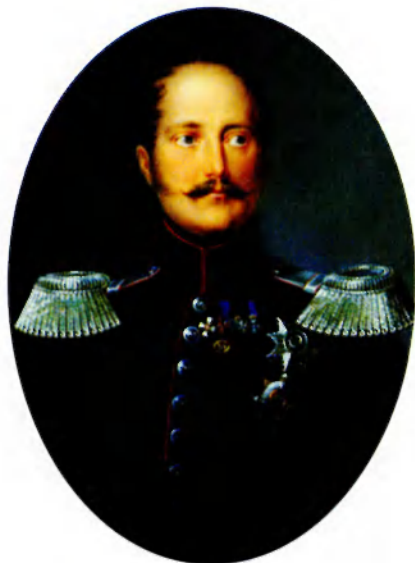
Император Николай I. Ок. 1850. Худ. И. Винберг