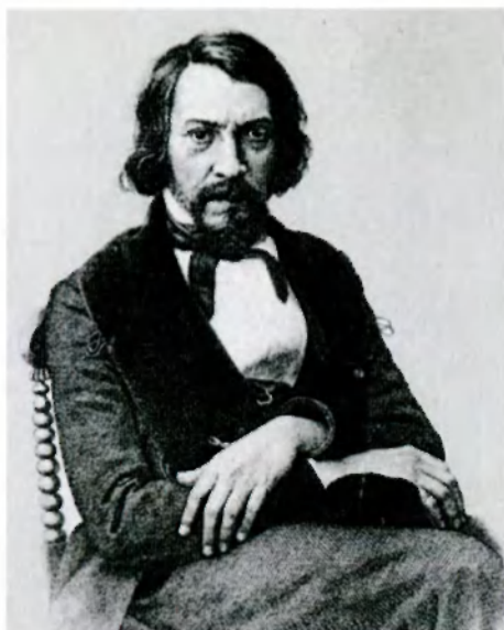
Алексей Степанович Хомяков. Вторая половина 1850-х гг. Фотография