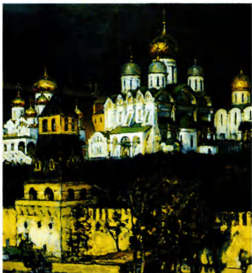
Московский Кремль. Соборы. 1894. Худ. А. Васнецов. Фрагмент