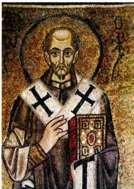
Иоанн Златоуст. XI в. Киев