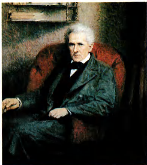
Александр Васильевич Никитенко. 1877. Худ. И.Н. Крамской