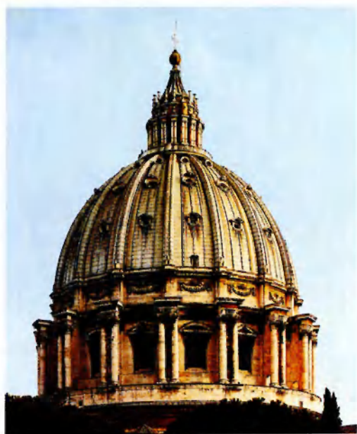
Купол собора св. Петра в Риме. Современная фотография