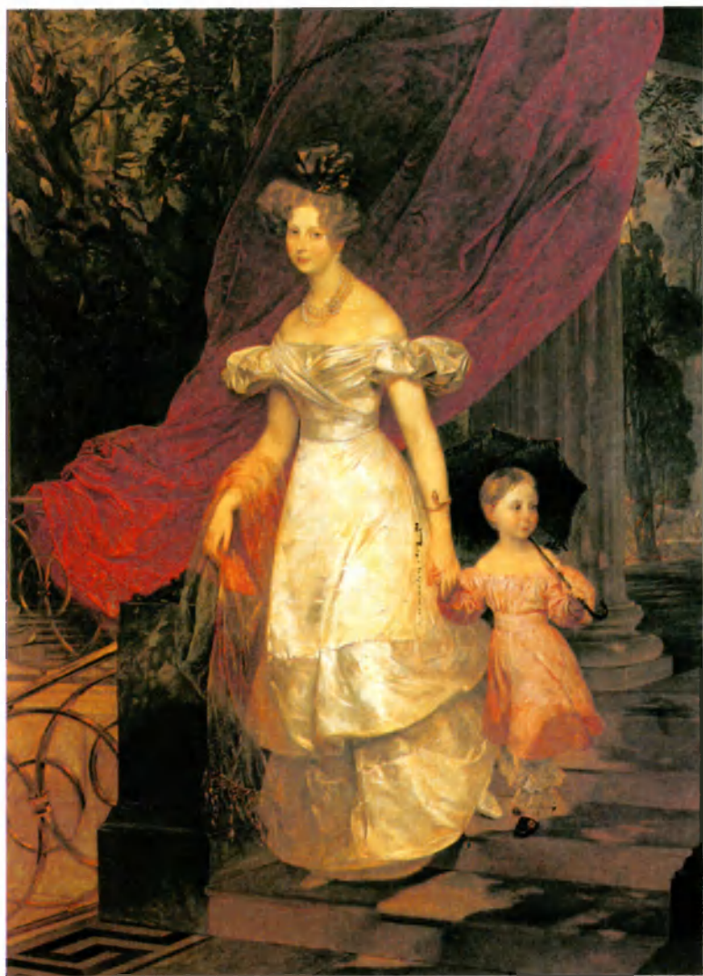
Великая княгиня Елена Павловна с дочерью. 1830. Худ. К. Брюллов