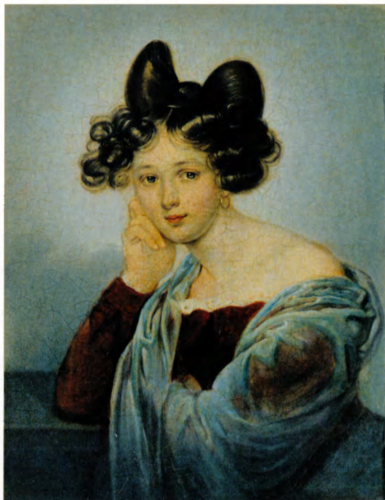
Элеонора Федоровна Тютчева. Середина 1820-х гг.