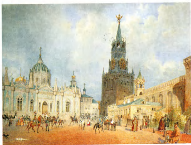
Внутренний вид Кремля 1838 Худ. И.Ф.Э. Герциер