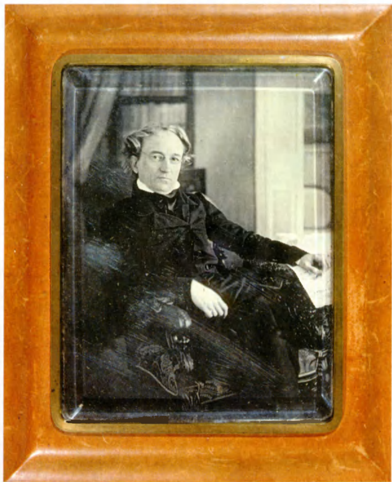
Федор Иванович Тютчев, Петербург. 1848–1849. Дажерротип