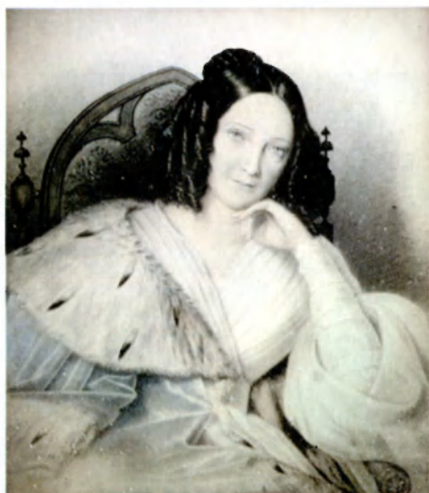
Клотильда фон Мальцан. 1840-е гг. Дагерротип