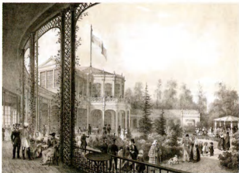
Павловский вокзал. 1850. Неизв. худ. Литография