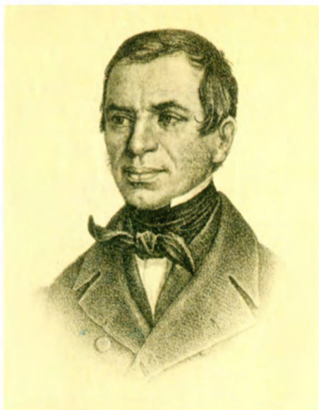
Михаил Петрович Погодин. 1846. Худ. Ф. Шир. Литография