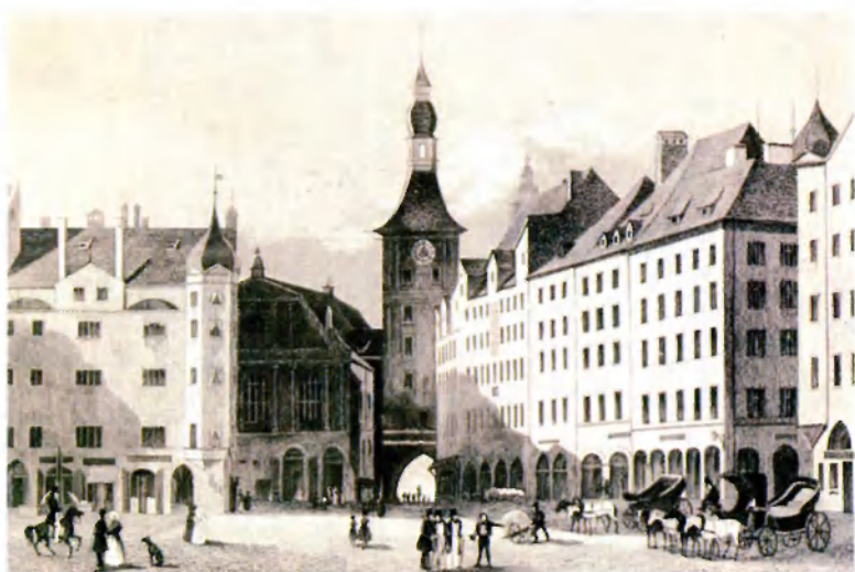
Городская рагуша в Мюнхене. 1840. Гравюра К. Герстнера по рисунку И. Хоффмейстера