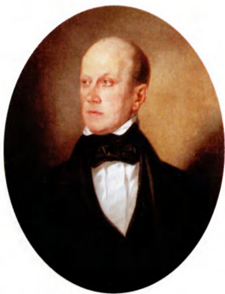
Петр Яковлевич Чаадаев. Начало 1840-х гг. Худ. А. Кошкин