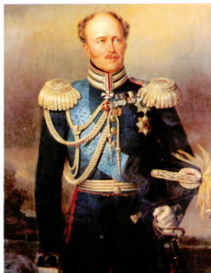
Александр Христофорович Бенкендорф. Копия Е.И. Ботмана с портрета Ф. Крюгера