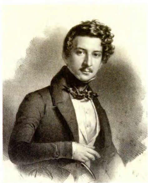
Иван Сергеевич Гагарин. Мюнхен 1835. Худ. Г. Бодмер. Литография