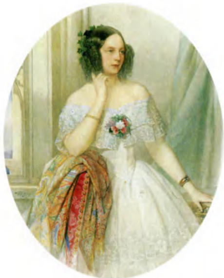
Великая княгиня Мария Николаевна, 1844. Худ. В. Гау