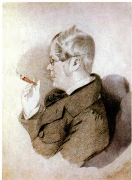
Петр Андреевич Вяземский. 1844. Худ. Т. Райт