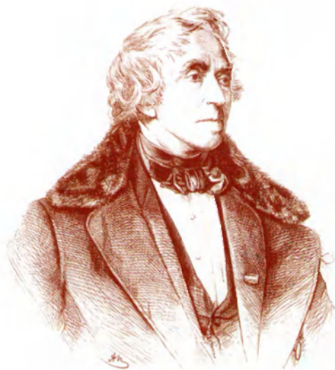
Фридрих Тьерс, 1858. Гравюра неизв. худ.