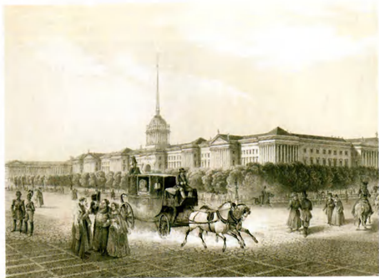
Адмиралтейство. 1840-е гг. Худ. Ж. Арцу. Тонированная литография