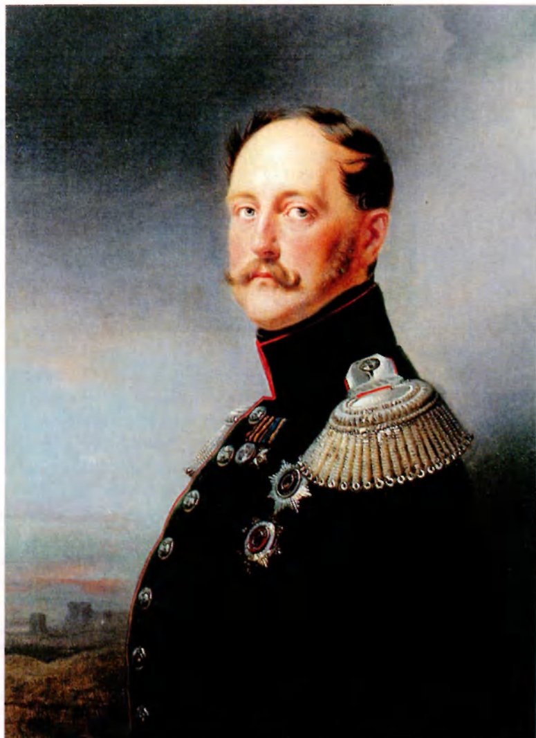
Николай I. 1852. Худ. Ф. Крюгер