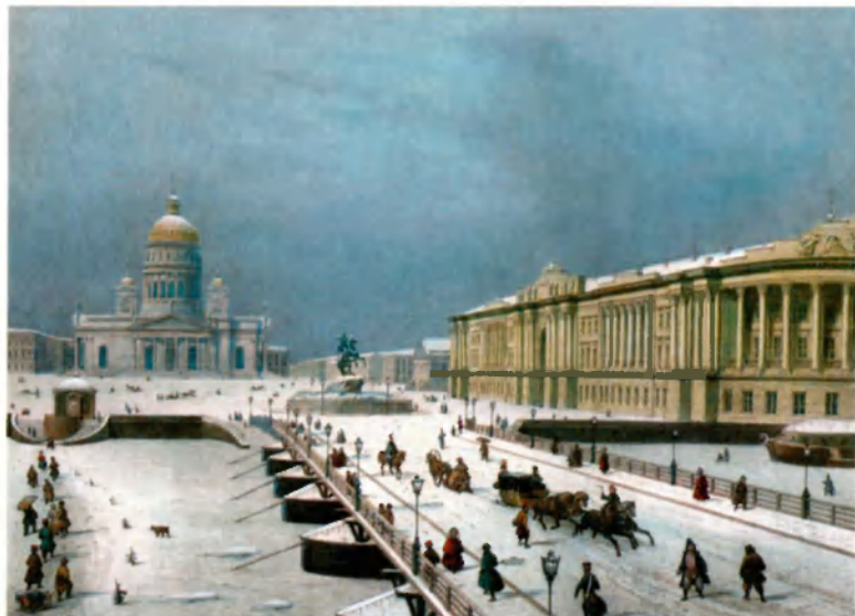
Исаакиевский собор и pontонный мост через Неву. 1840-е гг. Худ. Л. Бишебуа. Цветная литография