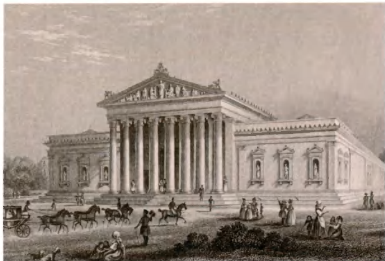
Мюнхен. Глиптотека. 1840-е гг. Гравюра Й. Ноппеля