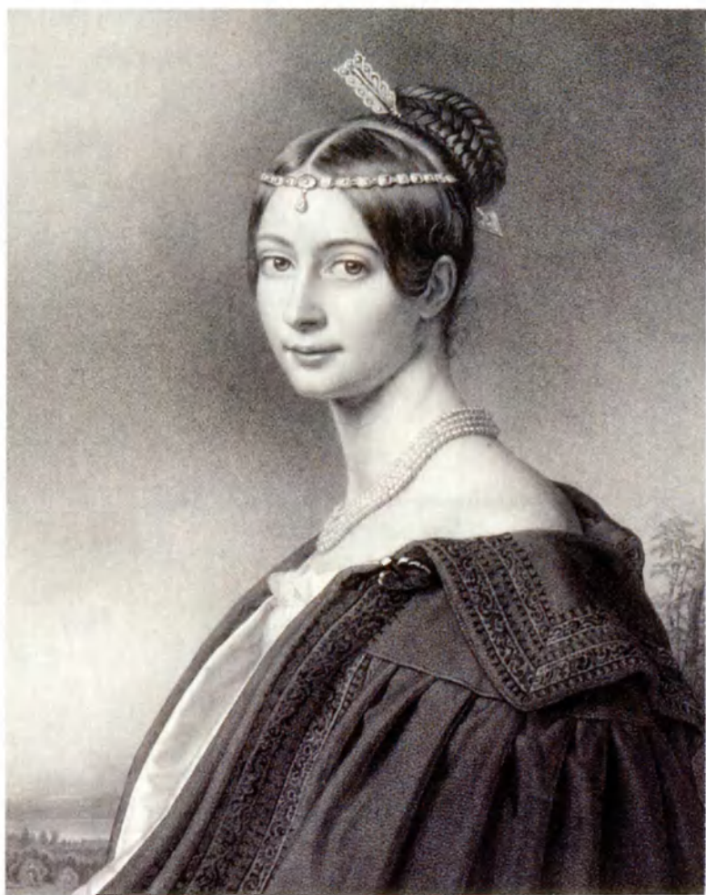
Эрнестина Федоровна Тютчева. Мюнхен, 1833. Литография Г. Бодмера с ориг. Й. Штилера