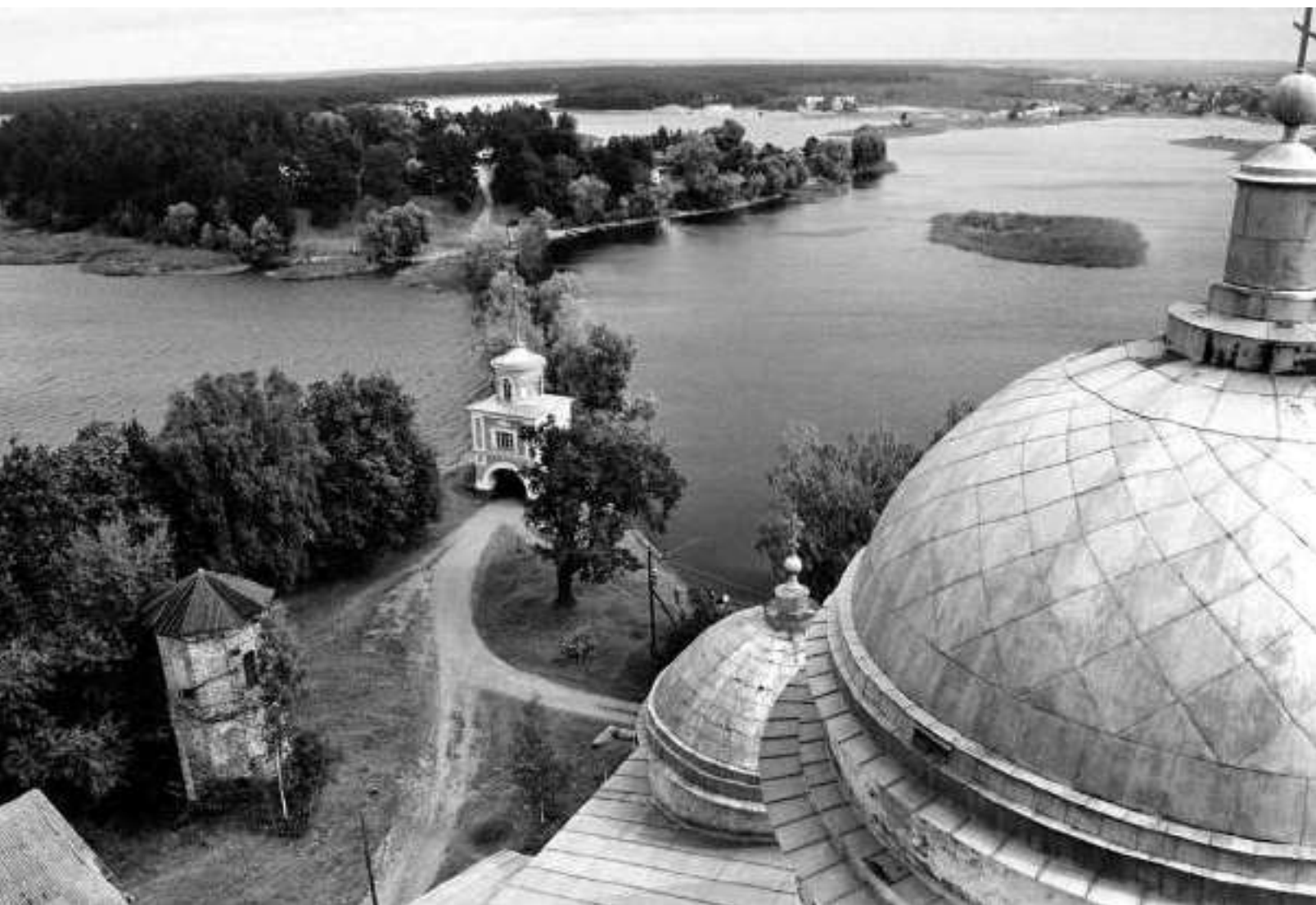
Вид с колокольни Богоявленского собора на полуостров Светлица.