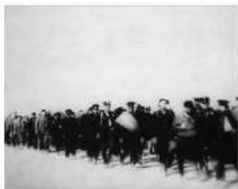
Колонна пленных польских полицейских в сентябре 1939 г. Кадры советской кинохроники «К событиям в Западной Украине и Западной Белоруссии»