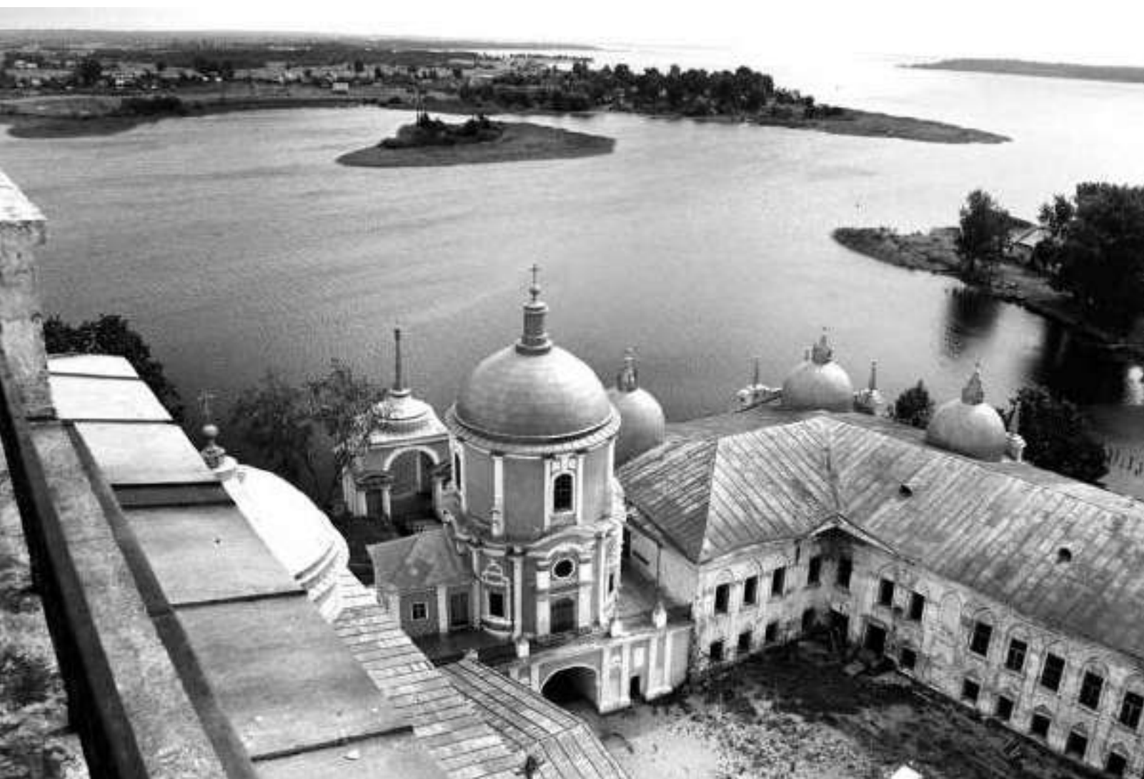
Вид с колокольни Богоявленского собора на надвратную церковь Нила Чудотворца (в 1939–1940 гг. в ней был устроен склад вещевого довольствия), справа здание бывших архиерейских и монашеских келий, в котором в 1939–1940 гг. были устроены жилые корпуса № 2 и 3 для военнопленных