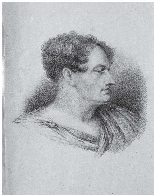
Гравюра с изображением лорда Байрона и авантитул III части «Мнемозины». 1824 г.

вид» [25, с. 172]. В.Ф. Одоевский остро критикует подражательность современных ему литературных произведений, а также весьма вольное отношение к грамматике русского языка, цитируя помещенные в «Вестнике Европы» стихи: