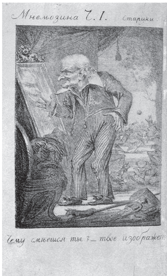
Иллюстрация к произведению «Старики и остров Панхай» из альманаха «Мнемозина»