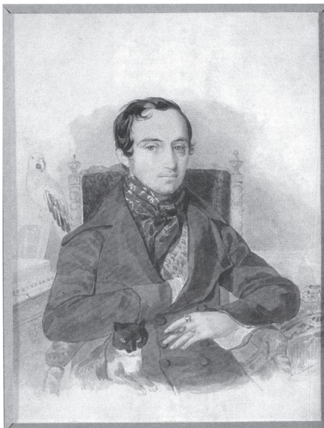
В.Ф. Одоевский. Акварель А.А. Покровского. 1844 г.

В «Русском Инвалиде» за 1824 г., № 13 напечатан проспект «Мнемозины» с пожеланиями ей успеха [31].