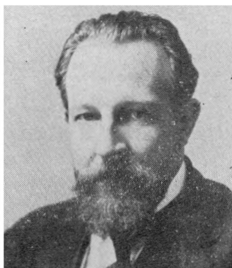
Н. Д. Авксентьев 1878-1943