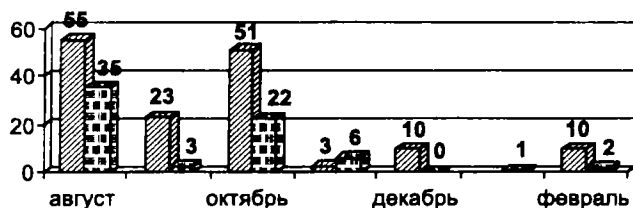
Рис. 1. Динамика арестов духовенства в августе 1937 – феврале 1938 года:

Анализ динамики производимых арестов отчетливо показывает (рис. 1) чередование подъемов и спадов активности при общем уменьшении ее амплитуды: за августовским пиком следует сентябрьский спад, и новый пик в октябре, не достигающий размера августовского. Затем новый спад в ноябре и далее – затухание интенсивности арестов в январе-феврале 1938 года.