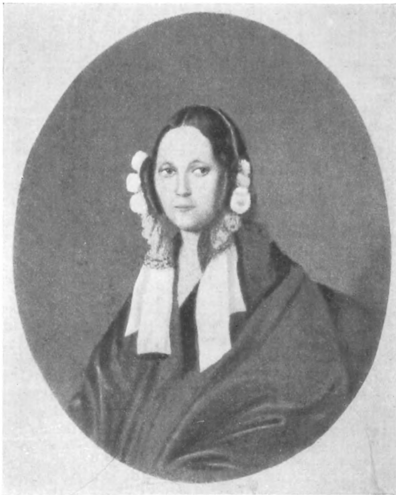
А. В. ЯКУШКИНА (1830-е годы).