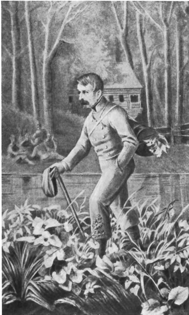
И. Д. ЯКУШКИН (с рисунка сепией, 1840-е годы).