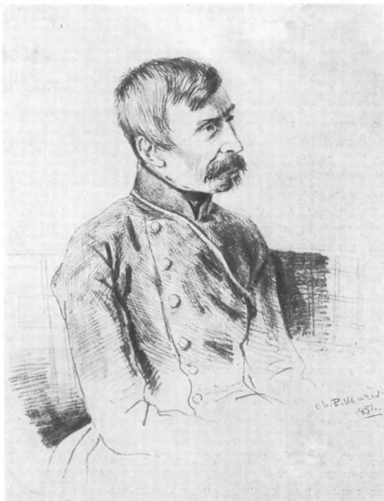
И. Д. ЯКУШКИН (с портрета работы П. Мазера. 1851 г.).