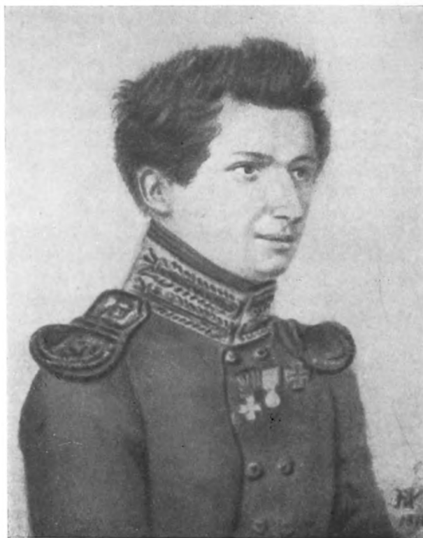
И. Д. ЯКУШКИН (с акварели Н. И. Уткина, 1816 г.).