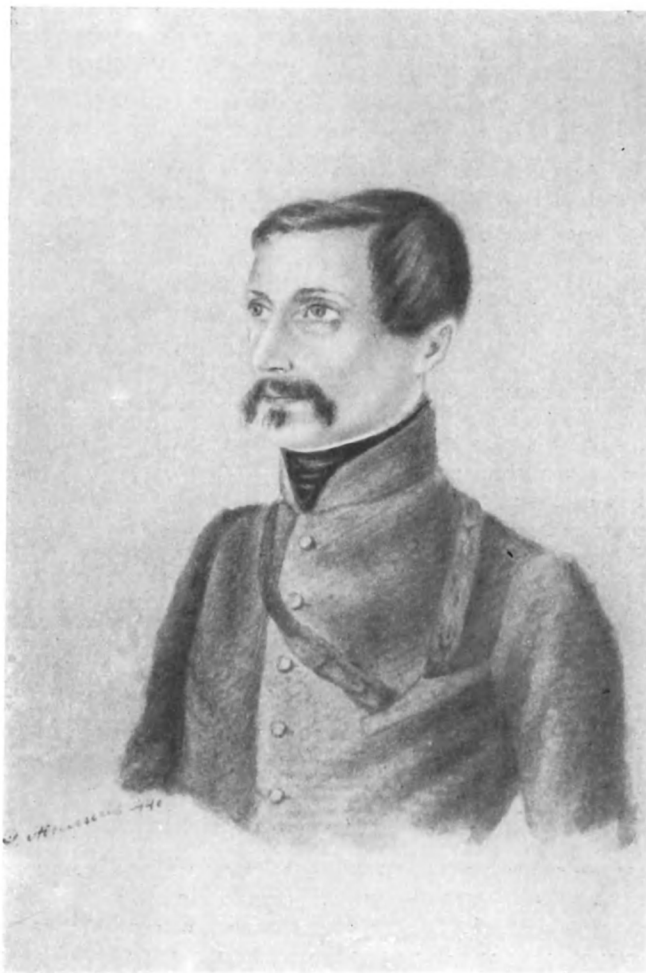
И. Д. ЯКУШКИН (с неизданного портрета работы Р. Жилина. 1844 г. Подлинный — в Государственном историческом музее в Москве).