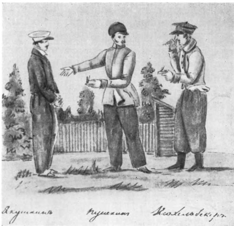
И. Д. ЯКУШКИН (слева), П. С. БОБРИЩЕВ-ПУШКИН, М. К. КЮХЕЛЬБЕКЕР в Петровском Заводе (1830-е годы).