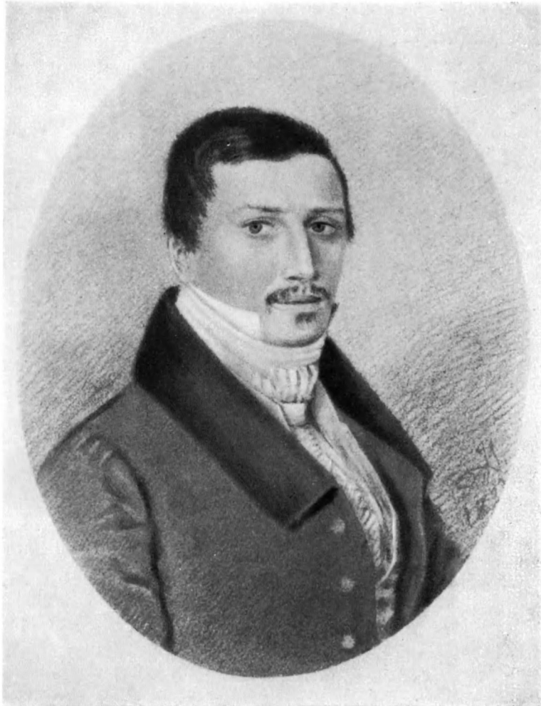
И. Д. ЯКУШКИН (с портрета работы Вязьена, 1823 г.).