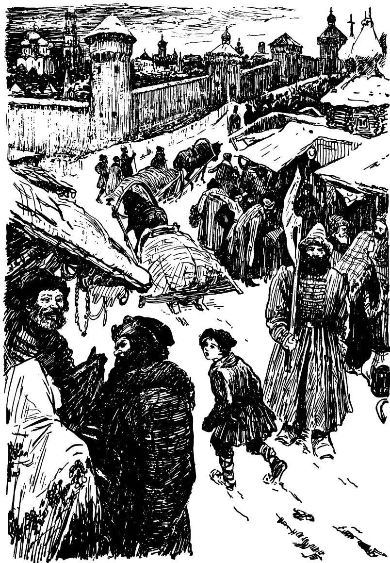
Потянулись прилавки с нарядными и диковинными товарами.