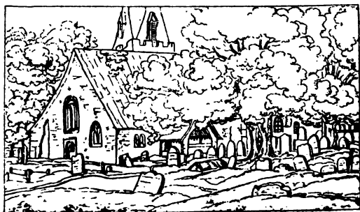
Ж «Сельскому кладбищу». Рисунки Б. А. Жуковского