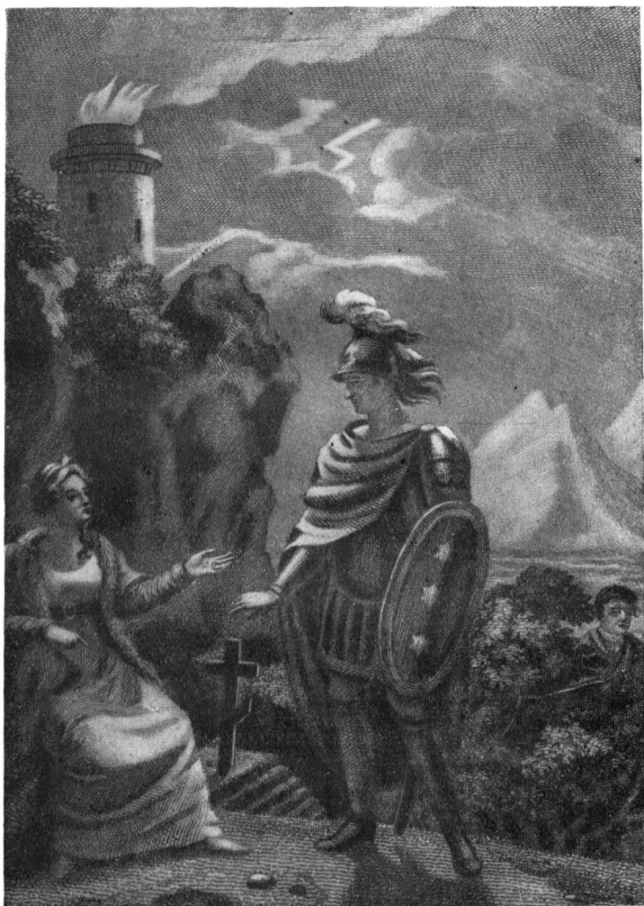
Иллюстрация к «Замку Смальгольму» («Иванову вечеру»).