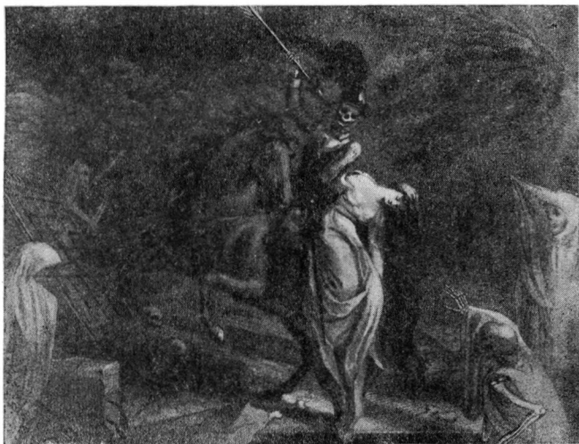
Иллюстрации к шотландскому изданию «Лепог» Бюргера.