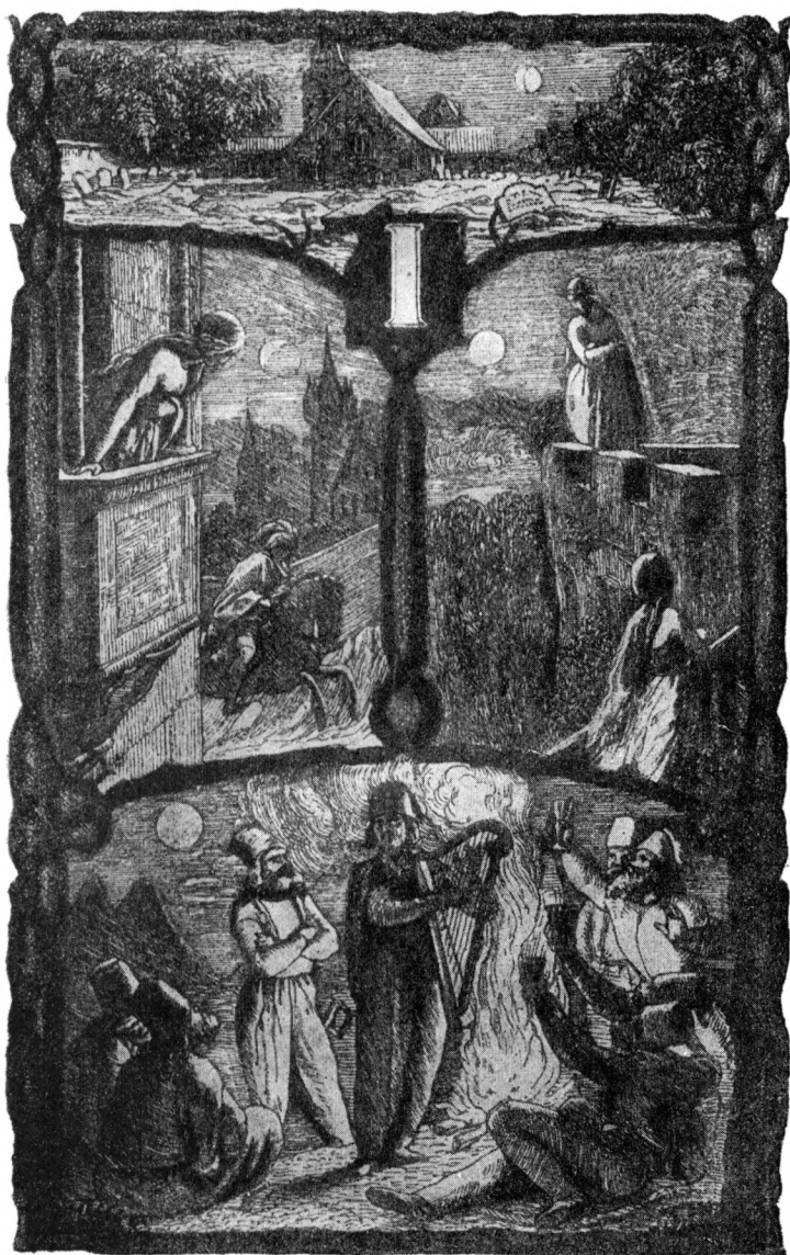
Фронтиспис первого тома пятого издания «Стихотворений» Жуковского (1849).