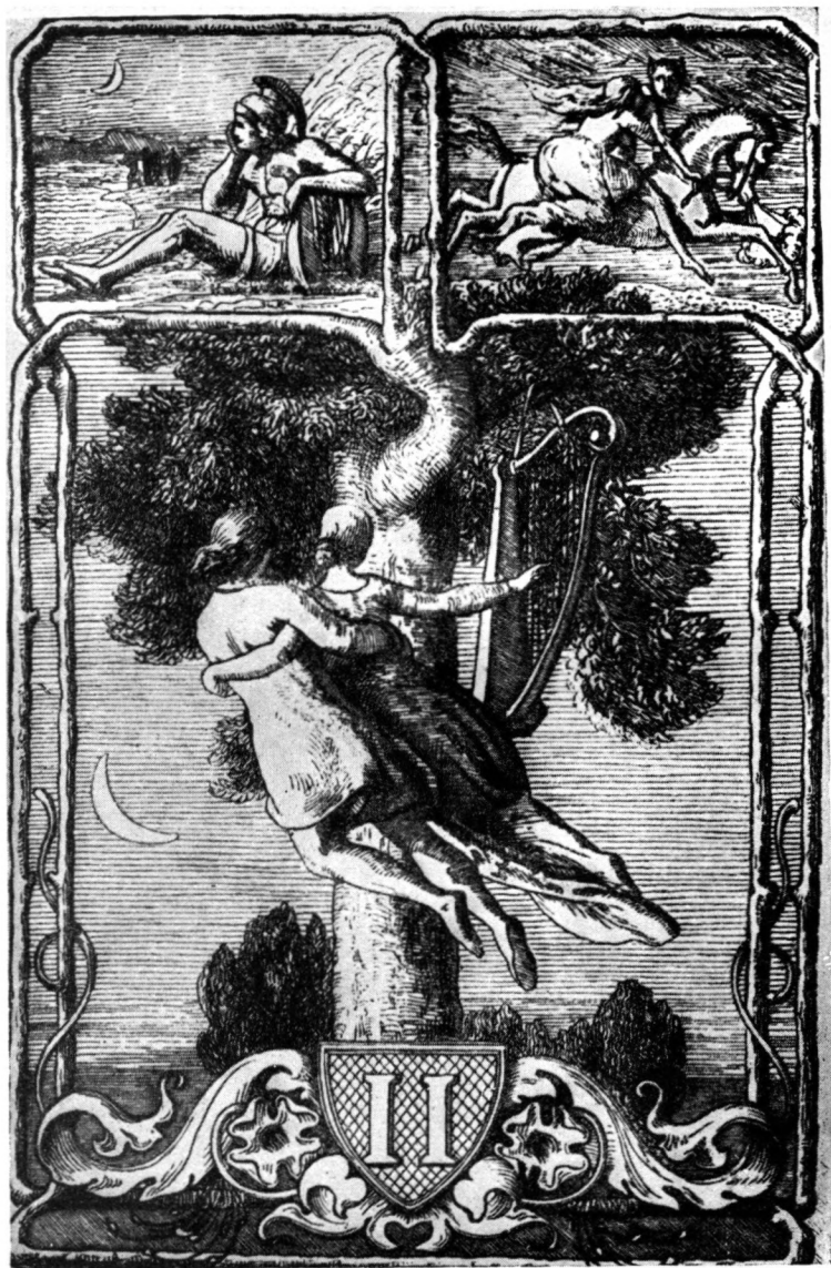
Фронтиспис второго тома пятого издания «Стихотворений» В. А. Жуковского (1849)