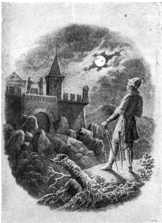
Фронтиспис к изданию «Баллад и повестей» 1831 года