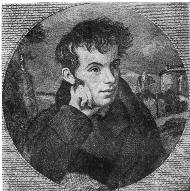
В. А. Жуковский (1818).