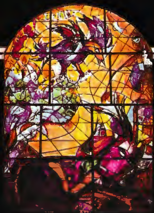
Витраж Марка Шагала в синагоге Медицинского центра Иерусалима